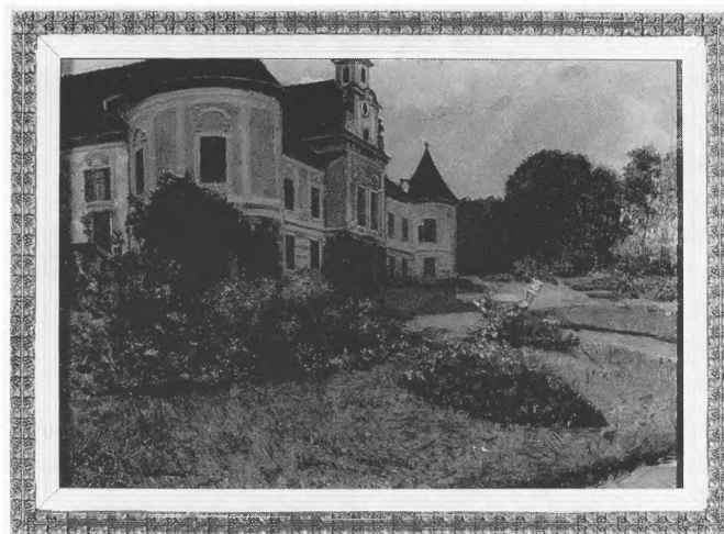
Italo Hochetlinger, Oroslavje (kopija po Bukovcu)

Slika u Hrvatskome povijesnome muzeju, motivski je i sadržajno istovjetna s opisanom. Razlikuje se, međutim, u detaljima i kvaliteti cjeline. Naime, pročelje dvorca perspektivno je slabije riješeno, pa se tako pojavljuje druga os prozora između prve kule i rizalita. Plastički ukrasi oko prozora su pojednostavljeni, dok na samoj kuli nema freske. Žaluzine na prozorima su zatvorene, otvorene su samo na prozoru prvoga kata druge kule. U dnu slike, ispred kule lijevo, sumarno je naznačena krošnja drveća i s kulom je vezuje zeleni "zid". Nema niskog raslinja ni plavičastih brda. U perivoju, u srednjem planu, ispred vrtnog stolca dodan je okrugli bijeli stol.