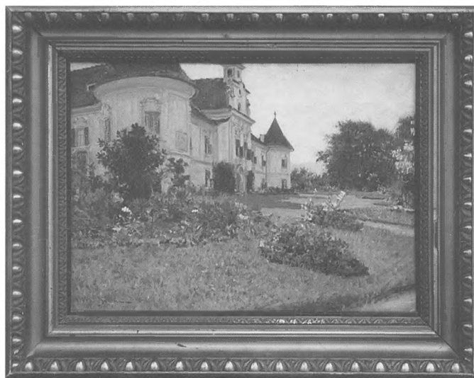
Vlaho Bukovac, Oroslavje , 1898.

Na slici u Galeriji "Akvamarin" fasada dvorca dobro je perspektivno riješena. Plastički ukrasi iznad prozora detaljno su razrađeni. Na prvoj, prednjoj kuli, u dijelu prvog kata, vidljivi su tragovi freske. Žaluzine prozora na fasadi su otvorene i kroz