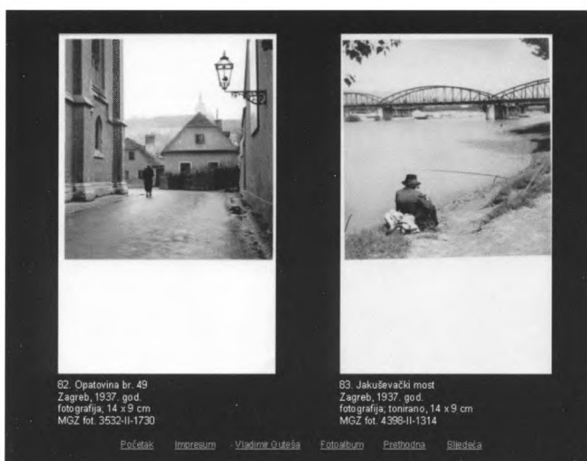
82. Opatovina br. 49 Zagreb, 1937. god. fotografija, 14 x 9 cm MGZ fot. 3532-II-1730

In order to mark the occasion of the monograph exhibition “Vladimir Guteša - The First Photographer of the Zagreb City Museum” dedicated to the founder of the permanent photographic service of the Zagreb City Museum, there was a computer presentation of the work of this photography enthusiast that is available on CD-ROM. The CD-ROM was entirely designed and produced in the museum. It also holds the exhibition catalogue and deals with a part of the rich photographic archives at the Zagreb City Museum. The museum is planning further presentations of the photo archives holdings with the aim of making at least a small part of the holdings accessible to visitors and interested users.