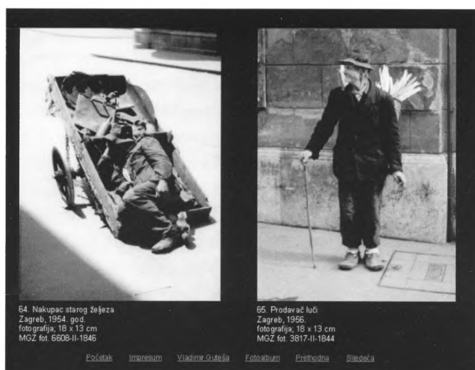
84. Nakupac starog željeza Zagreb, 1954. god. fotografija, 18 x 13 cm MGZ fot. 6806-II-1846

Početak Impresum Vladimir Guteša Fotoalbum Prethodna Slijedeća