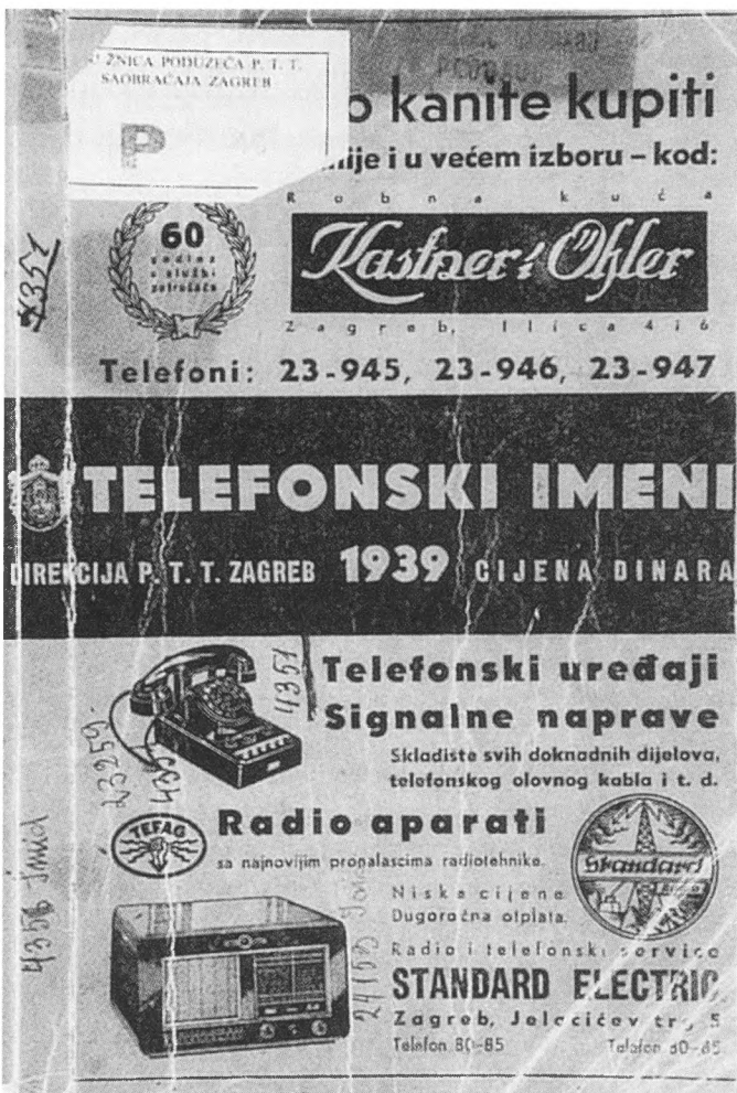
Telefonski imenik iz 1939. godine

To mark International Museum Day – May 18th – and International Telecommunications Day – May 17th – the HT Museum had presented the exhibition "Telephone Directories from Books to CD-ROMs". In preparing the exhibition the HT Museum collaborated with numerous similar institutions in Croatia and abroad, and this resulted in the collection of valuable data published in the exhibition catalogue. Visitors had the opportunity of seeing, for the first time, reprints of the first telephone directories of Germany, Italy, Hungary and Austria, all of which are valuable additions to the Museum's collection of telephone directories, a collection that will continue to receive systematic treatment. The unique collection of telephone directories is an integral part of the Museum Library and one of the specific features of the HT Museum.