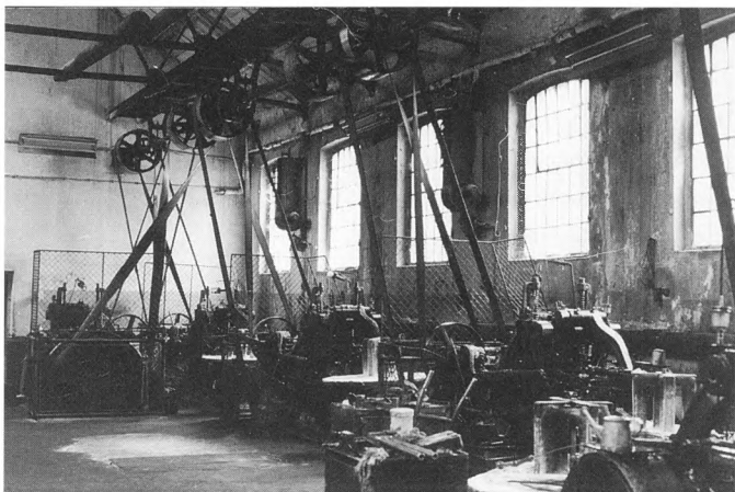
Ljepota industrijskog gesamtwerksa: odjel za šiljenje potkivačkih čavala sadrži originalno patentirane strojeve iz prvog desetljeća 20. stoljeća i prvorazredni je spomenik tehnikalija - još i danas koristi jedinstvenu obrtnu silu prijenosnih kola i remenica.