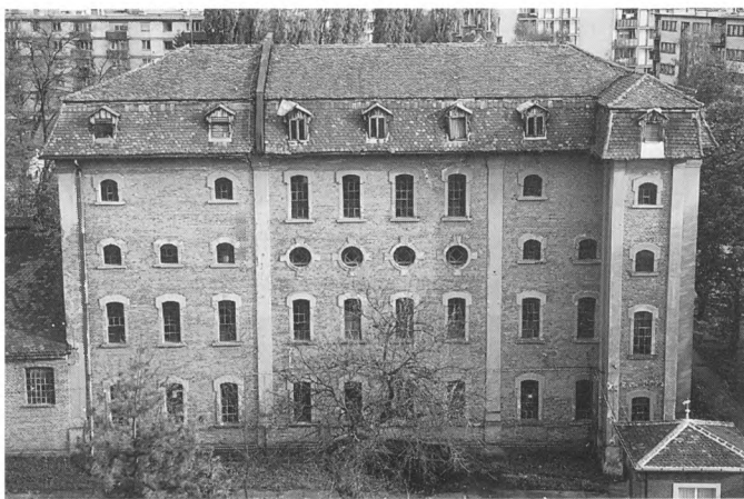
Dojmljiva ciglena arhitektura Mustadove tvornice potkivačkih čavala u Karlovcu čuva svoje srednjeeuropsko-skandinavsko rodoslovlje: ekspresivna pozornica kapitalizma i stroge funkcionalne organizacije između svjetskih ratova

Radne grupe kojoj valja raditi na definiranju jedinstvenog sustava kriterija u tu svrhu, ujedno promičući i ideju primjerenog udjela industrijskog naslijeđa u općem kulturno-urbanom krajoliku 21. stoljeća.