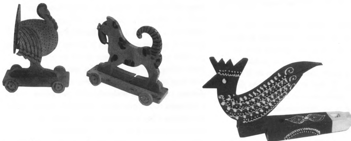
Bogato ukrašene dječje drvene igracke

Unfortunately, the exhibition was not accompanied by a poster campaign or television commercials, so that the media presentation did not do justice to the effort put into the exhibition or its value. This was not due to a lack of good will on the part of the authors of the exhibition, monograph and film, but rather on the lack of interest on the part of journalists and the media, who unfortunately did not show sufficient understanding for this segment of our heritage. Nevertheless, it is our opinion that the result of this project (regardless of the effort expended, exhibitions come and go), is a comprehensive monograph about traditional Croatian culture, the first and only such publication in Croatia.