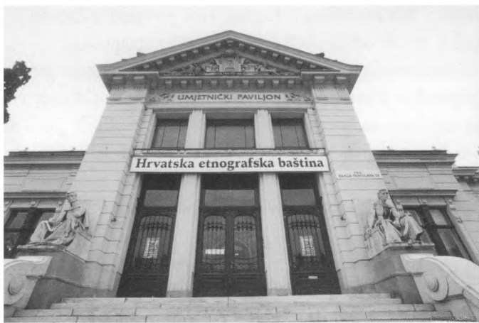
Zgrada Umjetničkog paviljona u kojoj je bila postavljena izložba Hrvatska etnografska baština

muzealaca. Posebice je bilo primamljivo ostvariti opširnu i dobro opremljenu monografiju, bogato ilustriranu, profesionalno grafički pripremljenu i otisnutu u dobroj tiskari. U desetljećima rada u znanstvenom institutu, gdje znanstvenici uz pomoć priučenih suradnika rade sve poslove na pripremi institutskih izdanja osim tiskarskih, nije se mogla ni sanjati takva prilika. I, eto, ona se pružila!