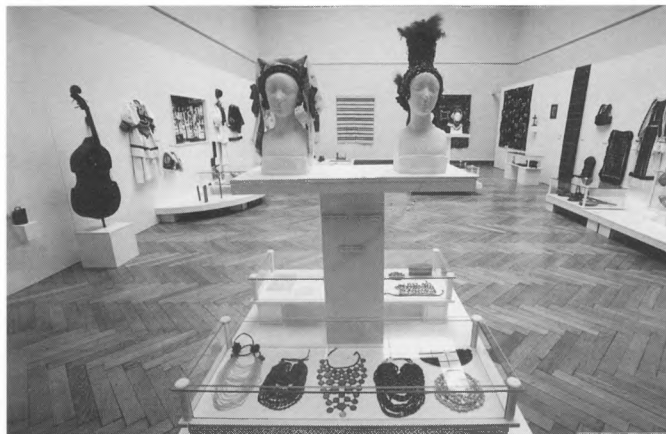
Dio postava - u prvom planu ženska oglavlja i nakit

Fundusi naših etnografskih muzeja i zbirki počeli su se formirati i prije nastanka same struke i pojave prvih etnologa, pod vodstvom vrijednih utemeljitelja i ljubitelja etnografske baštine, koji su često preferirali određene teme i artefakte. Fundusi su se