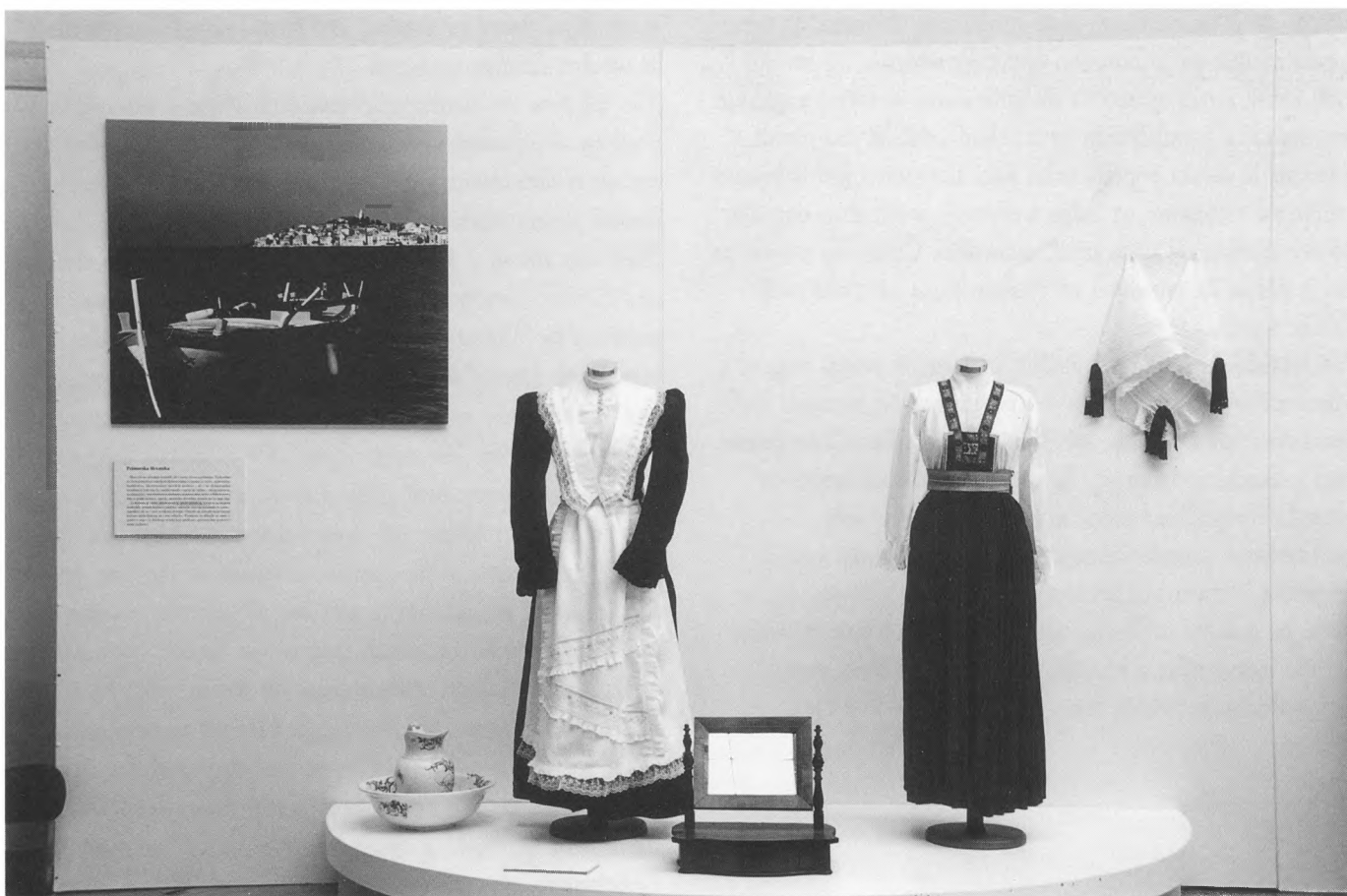
Gradska odjeća žena iz Splita (poč. XX. stoljeća)

jadnu propagandu, na izložbu “dolutati” mnogi, brojniji od posjetitelja izložaba u Hrvatskoj.