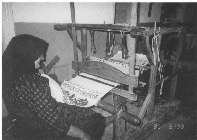
Tkalja iz Starih Mikanovaca, 1998.

Za dio predmeta pristiglih u Muzej u trogodišnjem razdoblju izrađena je i kompletna stručna etnološka dokumentacija. Kako je tijekom Domovinskoga rata, sve do početka 1997. godine oko 40 sanduka vrijedne etnološke građe bilo premješteno na sigurnije područje Hrvatske i deponirano u prostorima Gradskoga muzeja Varaždin, po povratku i temeljitom pregledu uočena su i različita neminovna oštećenja. Prije svega zbog neprimjerenog čuvanja, dugogodišnje spakiranosti, zaštite naftalinom i fumigacijom. Tekstil je trebalo podvrgnuti temeljitom zahvatu konzervacije, posebice narodne nošnje, komplete i pojedinačne dijelove, ali i druge tekstilne uporabne i ukrasne predmete, obaviti pranje i tradicijsko "uređenje" - slaganje, ulaganje i peglanje prema pravilima struke. To je dijelom i učinjeno tijekom 1998. godine uz pomoć suradnica - žena s terena. Istodobno je popravljen i restauriran dio kućanskog inventara od drva, primjerice kobilashi - sanduci za