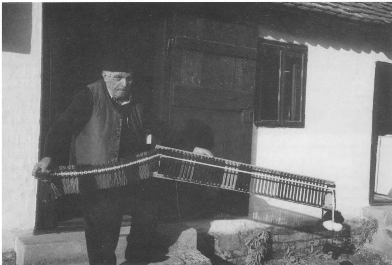
Jedan od današnjih izrađivača tradicijskog rukotvorstva iz Otoka, 1999.

U Gradskom muzeju Vinkovci još nije realiziran stalni postav ni za jedan odjel.