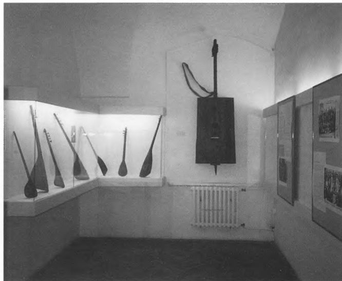
Detalj s gostujuće izložbe Tambura - tradicijsko glazbalo , u Muzeju Slavonije u Osijeku, 1997.

Tijekom 1998. godine Etnološki odjel Gradskog muzeja Vinkovci obogaćen je donacijom (a dijelom i kupnjom) više od tri stotine raritetnih i zanimljivih predmeta iz Atelijera Vanje Radauša, najviše s područja Županije, ali i s područja Đakova i Slavonskoga Broda. Na žalost, velik broj predmeta iz ove zbirke u Gradski muzej Vinkovci pristigao je u dosta lošem stanju, zbog dugogodišnje neadekvatne pohrane.