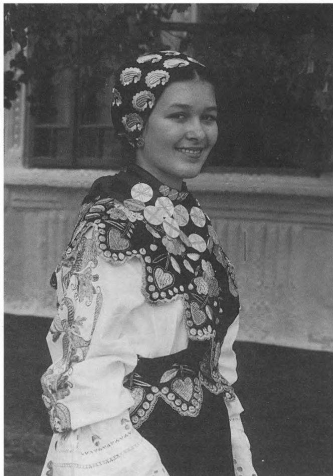
Djevojka odjevena u u tradicijsko ruho sela Otoka, 1999.

U vrijeme održavanja Festivala hrvatske tamburaške glazbe u Osijeku, vinkovačka izložba o tamburi preseljena je u ovaj grad i postavljena u Muzeju Slavonije u Osijeku. Dok je izložba trajala