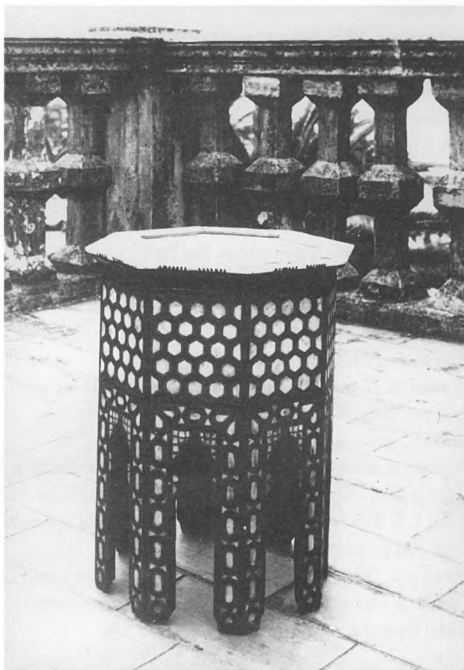
Stolić iz Bukovčeve obiteljske kuće, snimljen na terasi