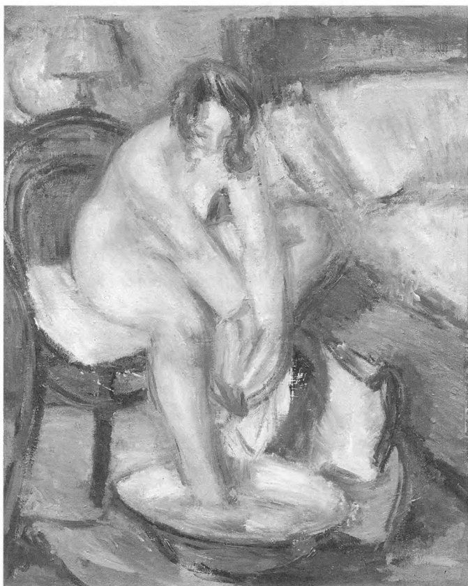
Gabro Rajčević: Pred počinak , 1942./43., ulje na platnu (78x63cm)

Mjesna zajednica Cavtata u želji da se Galerija Vlaho Bukovac nakon nekoliko godina ponovno otvori za posjetitelje, sklopila je ugovor s Umjetničkom galerijom Dubrovnik kojim je Galerija Vlaho Bukovca dodijeljena na upravljanje i korištenje Umjetničkoj galeriji u Dubrovniku. Godine 1976. izvršena je primopredaja zgrade obiteljske kuće Vlaha Bukovca u Cavtatu, s