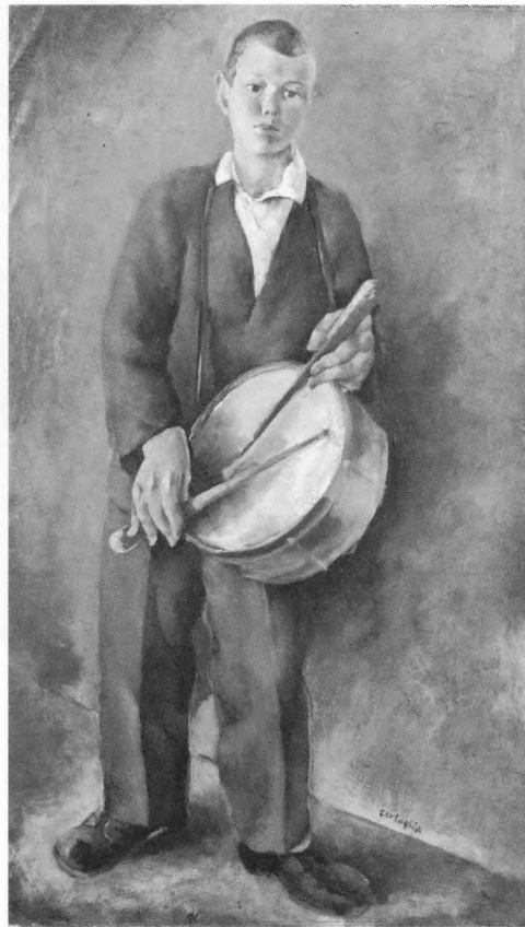
Marino Tartaglia: Mali bubnjar, 1926., ulje na platnu (136x79cm)

Devedesetih godina, tj. od 1995. kada je održana I. međunarodna bijenalna izložba "Mediterranski susreti", za fundus se otkupljuju djela za međunarodnu zbirku. Ova zbirka uz otkupe povećana je i za nekoliko donacija i ima 10-ak umjetnina autora iz Izraela, Egipta, Italije i