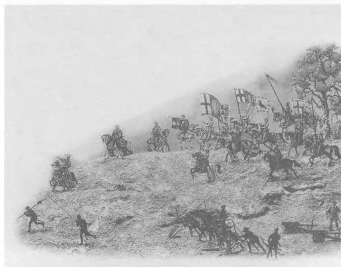
Kositreni vojnici: prizor iz bitke

Kameni vrt Sanspareil površine 13 hektara i služi kao primjer uređenja pokrajinskih vrtova i lijep je primjer parkovne arhitekture.