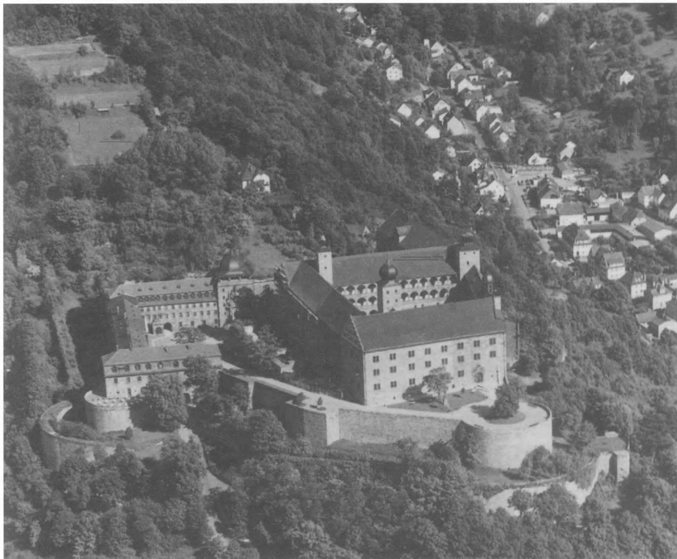
Tvdava Plassenburg u kojoj su smješteni: Njemački muzej kositrenih figura Plassenburg, Zemaljski muzej Gornja Maina i Državni muzej

Povijest dvorca u kojem je smješten Muzej seže u daleku franačko-njemačku prošlost.