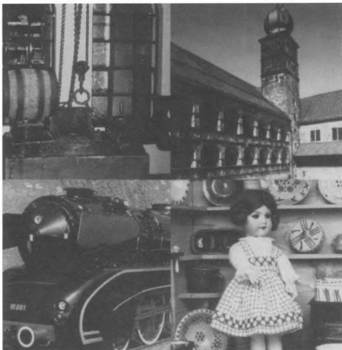
Državni muzej Plassenburg, Bavarski muzej piva, Muzej lončarstva Thurnau i Njemački muzej parnih lokomotiva Neuenmarkt

Plassenburg je simbol kulmbaškog kraja i jedna od najpoznatijih tvrđava Njemačkog Carstva izgrađen na stijeni od pješčanika. Svoj postanak zahvaljuje grofovima von Diessen und Andechs s Amerskog jezera, koji su ovo imanje na gornjoj Majni naslijedili 1057. godine od Schweinfurtskoga grofa. Dvorac je izgrađen 1135. godine kao zaštita trgovačkih putova koji su vodili preko Maine. U njegovu podnožju razvilo se trgovačko naselje. Nakon izumiranja grofova von Diessen und Andechs pripao je ženidbenim ugovorom tirinškom grofu Orlamündeu. Posjed Gornje Maine pripao je ugovorom o nasljedstvu nürnberskom grofu Jochanu II. Od 1340. do 1806. godine vladaju Plasenburgom različiti ogranci Hochenzollern. Dvorac je postao 1398. glavno sjedište i rezidencija, sve do premještanja dvorskog života u Bayreuth 1603. godine, a nakon toga ostao je Plassenburg u funkciji tvrđave za cijelo okolno područje. Pod upravom Hochenzollerna doživio je grad Kulmbach svoje građevno i kulturno oblikovanje.