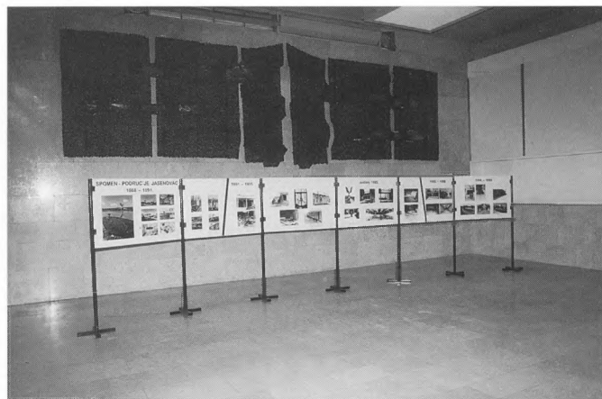
Detalj s informativne izložbe "Spomen područje Jasenovac 1968.-1991."

U sljedećim godinama obilježeni su i uređeni grobni lokaliteti (Limani, Mlaka, Uštica, Krapje i Donja Gradina), dograđeni novi radni prostori i pokrenuta samostalna izdavačka djelatnost, najprije u obliku internog glasila "Poruke", a zatim i biblioteke istog naziva. Organiziraju se predavanja, znanstveni skupovi, projekcije dokumentarnih filmova i producira snimanje dokumentarnog filma o logoru "Evandjelje zla". 5 Tiskaju se razglednice, značke i privjesci, a brojem posjetilaca Memorijal nadmašuje gotovo sve muzejske institucije u zemlji. U sastav Spomen područja 1983. godine ulaze svi lokaliteti bivšeg logora