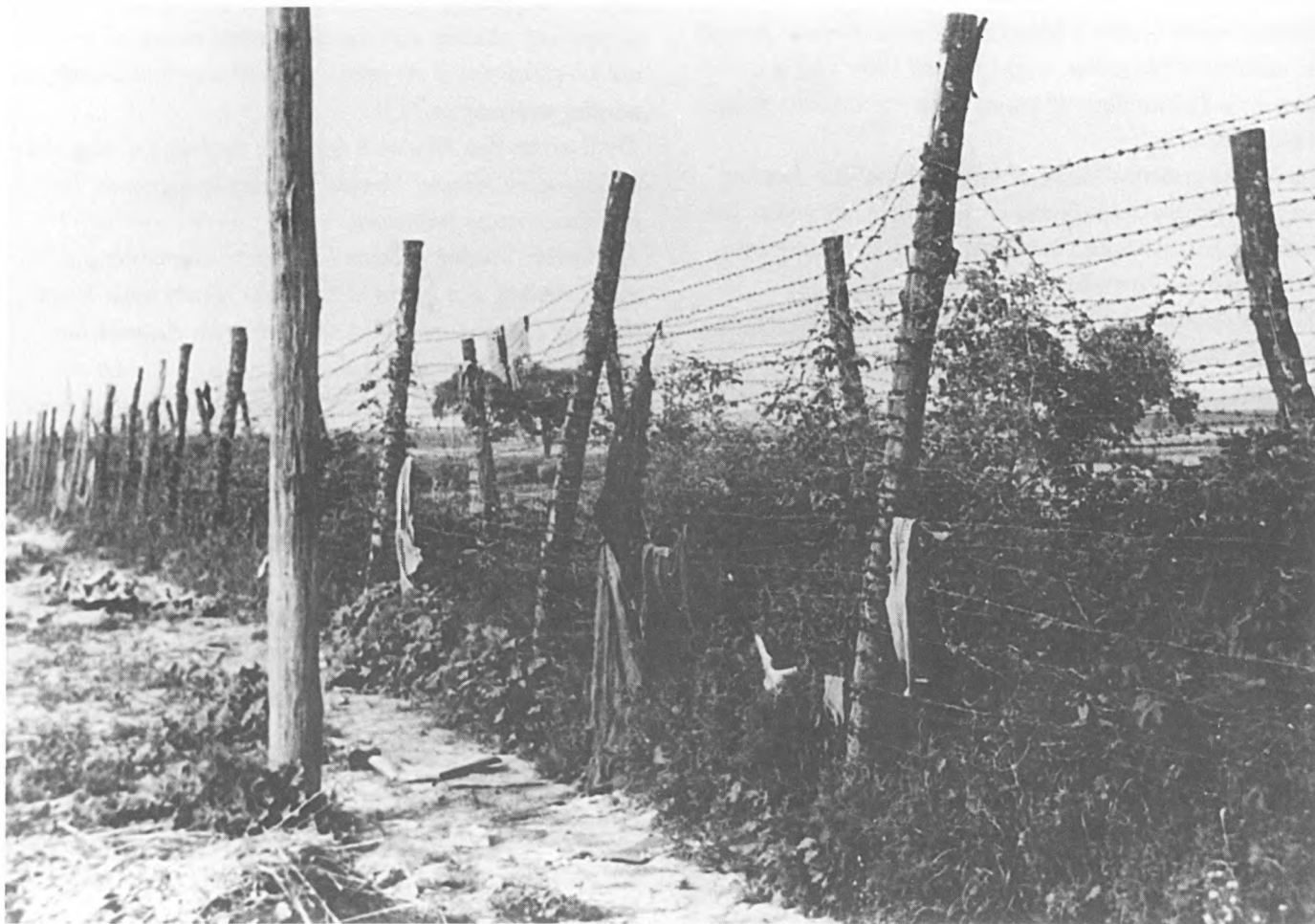
Logoraška žica s ostacima odjeće Jasenovac, 11. V. 1945. godine

Kada su jedinice XXI. srpske divizije 2. svibnja 1945. ušle u porušeno naselje i nedaleko od njega logor Jasenovac, većina logorskih objekta bila je uništena. Prvi uvidaj o zatečenom stanju u logoru obavila je Okružna komisija Hrvatske za utvrđivanje zločina okupatora i njihovih pomagača iz Nove Gradiške 11. svibnja 1945. godine.