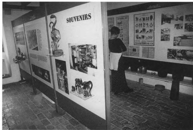
Istarski suveniri izloženi na istoimenoj izložbi

Neposrednosti doživljaja pridonose i predmeti izloženi slobodno u prostoru. Niše kraj prozora, na primjer, nakrcane su, baš kao i štandovi na kojima se i prodaju suveniri. Vitrina nema, osim dvije, koje su posuđene iz predvorja ureda načelnika općine Svetvinčenta. U njima se nalaze predmeti koji su nagrađeni na smotri "izvornog istarskog" suvenira, a postavljene su na izložbi u kompletu sa svojim sadržajem upravo kao ilustracija valorizacijskog pristupa koji autori izbjegavaju. Ne treba zaboraviti spomenuti da je informacija o izložbi dostupna posjetiteljima na početku izložbenog prostora na tri strana