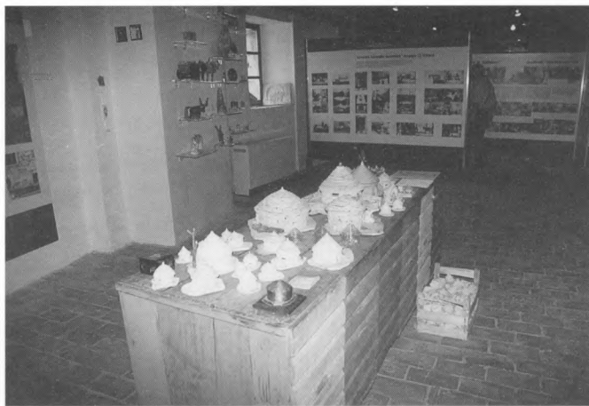
Detalj izložbe Od ordenja do simbola identiteta s istarskim kašunima u prvom planu

Da bi posjetilac uopće došao do izložbe, nužno je prethodno razgledati stalni postav u kojem su izloženi zanatski alati i poljoprivredna oruđa (ordenje) te tradicijski tekstil i odjeća, narodne nošnje istarskih seljaka. Taj je uvod, prema autorima, nužan jer upućuje na izvorište: tradicijsku kulturu. Izložba interpretira pojavu suvenira koja izlazi upravo iz tradicijske kulture i ponovno joj se vraća kao njezin dio.