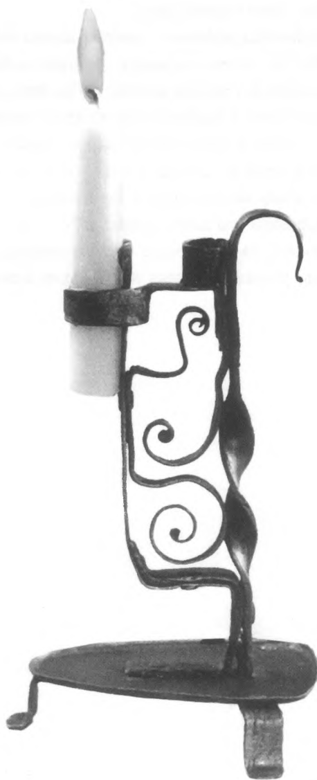
Svijećnjak XVIII. stoljeće

Dio predmeta prikazanih na izložbi većinom pripada zbirci Slovenskog etnografskog muzeja. Korišteni su uglavnom na selu, no nekoliko ih potječe i iz trgovačkih ili gradskih sredina. Neki eksponati posuđeni su iz Belokranjskoga muzeja u Metliki, Gradskoga muzeja Ljubljana, Slovenskoga vjerskog muzeja u Stični, Austrijskoga etnografskog muzeja u Beču i iz privatne zbirke gospodina Andreja Krbavčiča. Većina izloženih rasvjetnih