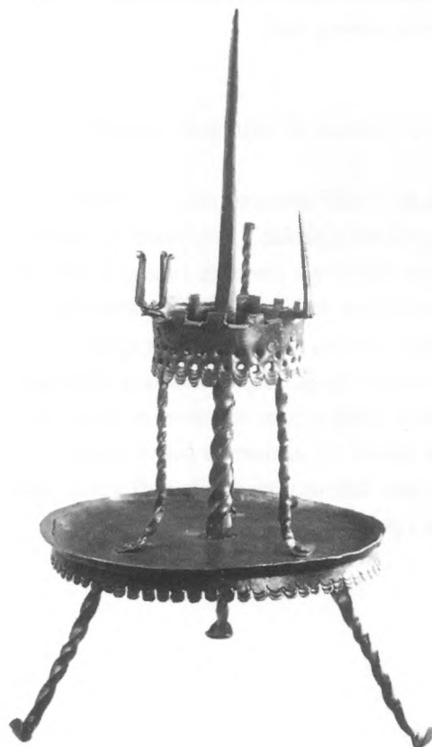
Kovani svijećnjak, XVI. stoljeće

U Etnografskome muzeju u Zagrebu od 29. lipnja do 3. listopada 1999. godine bila je postavljena gostujuća izložba Slovenskog etnografskog muzeja iz Ljubljane pod nazivom Udomaćena svjetlost , Etnološki pogled na