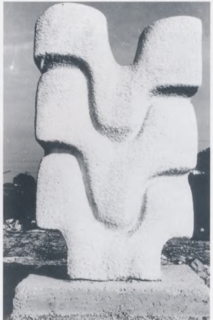
Milena Lah, 1970.

Autorska grupa je upravo pred zgotavljenjem Projekta uređenja Parka skulptura Dubrova. Po projektu će se pristupiti uređenju Parka (radovi su u toku od ranije) za proglašenje Parka skulptura Dubrova Muzejem suvremenog kiparstva na otvorenome. Dovršenje uređenja prostora trebalo bi biti okončano (uvijek