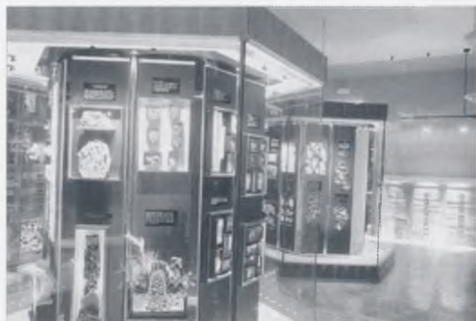
Svijet kukaca u šumi i na livadi

Činilo mi se muzeološki teškom zadaćom obraditi i izložiti predmete izvučene iz njihova prirodnog ambijenta, učiniti razumljivim, tako "gole", izdvojene od svoje okoline. U isto se vrijeme postavljao zahtjev za preglednošću među 4.500 eksponata izloženih u 286 oblikovne jedinice smještene u goleme, arhitektonski građene ormare i vitrine. Usprkos polumraku, ili možda upravo zbog njega, do izražaja dolaze suprotstavljeni odnosi u nizovima vodoravnih i okomitih kutija, pretinaca i ladica u kojima se pojedine izložbene cjeline pojavljuju potpuno samostalno, a ipak su neizostavni dio cijelog oblikovnog sklopa. Onaj tko istražuje (razgledava) postav (posjetitelj ili korisnik muzeja) nastojat će najprije na definiranju općeg stava. Tek tada započinje otkrivati pojedinačno. Ono mu se razotkriva samo po sebi, zapravo ga probuđeni interes navodi na otvaranje ladice za ladicom, izvlačenjem staklene kutije za kutijom u nastojanju da dokuči vrste i bogatstva njihovih sadržaja. Tako posjetitelj stječe određeni stav. Koliko će vremena provesti u svijetu kukaca ovisi o intenzitetu probuđenog interesa.