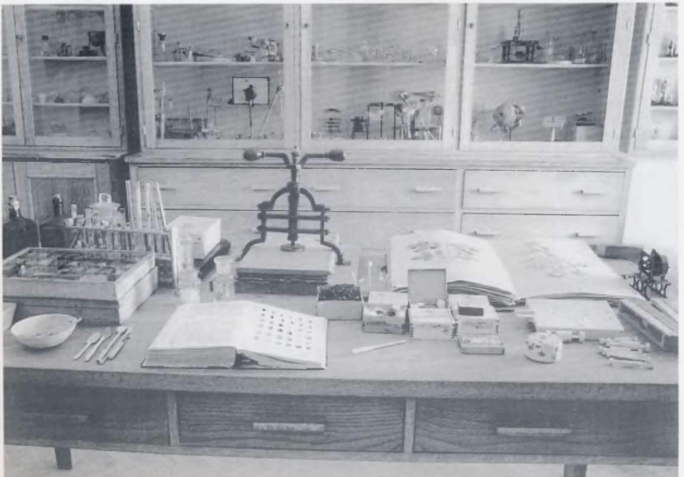
Radna soba Franje pl. Košćeca - dio stalnog postava

Profesor prirodopisa na varaždinskoj gimnaziji, Franjo pl. Košćec (1882.-1968.) neumorno je godinama sabirao svoje zbirke u široj okolici Varaždina, na obalama Drave, u pribrežju Ivančice i Ravne gore, sve do Trakošćana. Obradio ih je i preparirao, i to ne samo kukce, već cijela njihova izvorna staništa, nastambe i gnijezdišta, a za što slikovitiji i zorniji prikaz anatomije pojedinih primjeraka, vrsta, načina njihova života izrađivao je uvećane modele, koje je u početku uglavnom koristio u edukativne svrhe. Tek kasnije modeli postaju dio muzejske ekspozicije. Košćecove sprave oduševljavaju još i danas brojne posjetitelje svojom funkcionalnošću i ljepotom izrade. Koristio se njima u svom entomološkom, preparatorskom radu. Uz insekte, zanimala ga je i botanika. Sakupio je i ostavio vrijednu zbirku herbara s otprilike 15.000 primjeraka biljaka objedinjenih u stotinjak svezaka. Svoje je entomološke i herbarske zbirke, modele, crteže, sprave i pomagala, opsežnu dokumentaciju i knjižnicu prenio u vremenu od 1954. do 1959. godine u Gradski muzej Varaždin.