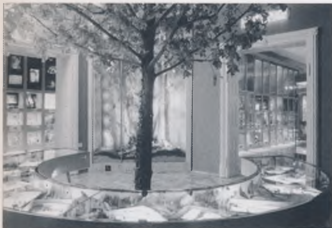
Svijet kukaca u šumi