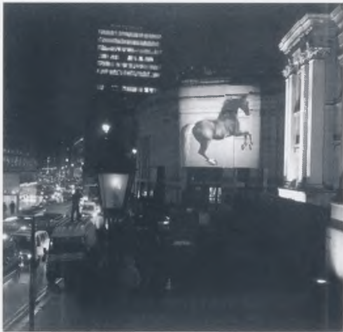
Stubbsov "Whistlejacket" projiciran na zid Nacionalne galerije 19. XII.1997.

pothvata, 2 Nacionalna je galerija, koja ima nešto više od dvije tisuće djela nastalih u razdoblju od 13. do početka našeg stoljeća - dakle, po veličini se ne može uspoređivati, na primjer, s pariškim Louvreom ili madridskim Pradom - danas jedna od najzanimljivijih i najposjećenijih svjetskih kuća sa stalnim postavom.