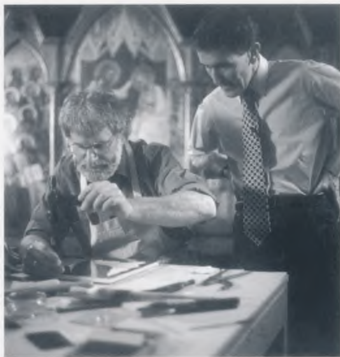
Ravnatelj Nacionalne galerije Neil MacGregor pri snimanju BBC-ove serije "Stvaranje remek djela"

Djela starih majstora danas postižu vrtoglave cijene, što znači da, uz sva druga ulaganja, galerija ne može povećavati svoju zbirku istim ritmom kao nekada. 10 Nove akvizicije neće, dakle, drastično utjecati na izgled stalnog postava, ali će svakako pridonijeti kvalitativnom bogaćenju zbirke, što pokazuje i izbor djela koje je galerija kupila u posljednje dvije godine. Među njima, ulje na platnu Antonisa van Dycka "Portret Françoisa Langloisa" (1637.?) značajno je i za daljnje