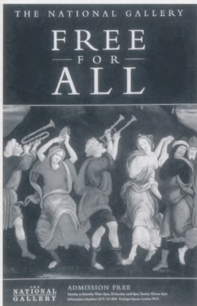
Ulaz u Nacionalnu galeriju je slobodan

A tijekom izložbe "Majstori svijeta: Nizozemsko slikarstvo "zlatnog doba" iz Utrechta", održane 1998., uz sjevernjačke majstore 17. stoljeća, koji su bili pod neospornim utjecajem Caravaggija, moglo se, u sobi I vidjeti i Caravaggiovo "Bičevanje krista" posuđeno iz Rouena i nikad prije izloženo u Britaniji 18 .