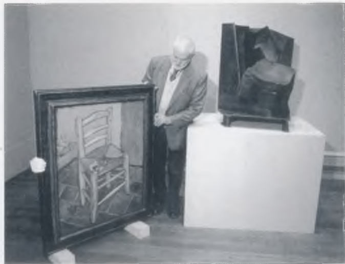
Sir Antony Caro sa svojom skulpturom radenom prema Van Goghovoj "Stolici"

Od 1994. u ciklusu "Stvaranje i značenje" izmjenjuju se izložbe na kojima se proučava nastanak, i u tehničkom smislu i u povijesnom kontekstu, i konačno značenje nekih od najznačajnijih djela iz zbirke. Ove su izložbe - na njima je, na primjer, bilo obrađeno djelo mladog Michelangela, pejzažno slikarstvo Petera Paula Rubensa, portret "Ambasadori" Hansa