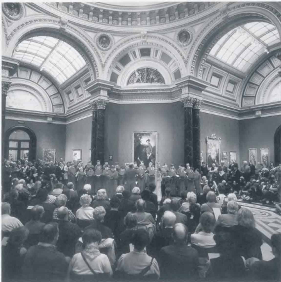
Koncert u izložbenoj dvorani br. 12, listopad 1997.

otvara nove načine prezentiranja svoje umjetnosti i pokazuje zapravo koliko je danas kompleksnija institucija od one iz 19 stoljeća, te kako je za ostanak među najvećima potrebno stalno pronalaženje novih modela prezentiranja.