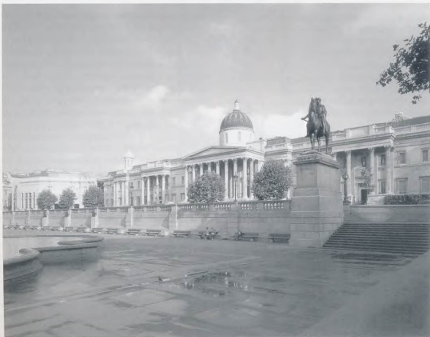
Londonska nacionalna galerija

Ovo je jedan od primjera kako Nacionalna galerija pokušava i najširoj publici približiti djela iz svog fundusa. "Izlazak na ulicu" čini se drastičnim načinom predstavljanja klasičnog rada, ali bez politike koja nije u stanju primjereno odgovoriti na zahtjeve suvremene publike Nacionalna bi galerija ostala samo ustajala ustanova. Danas, u vremenu velikih konkurencija, nije više dovoljno razmišljati u terminima poboljšavanja osvjetljenja, minimalnih preinaka u stalnom postavu, proširenja prostora pa čak i dobrih gostujućih izložbi, nego se inzistira da sve to bude u funkciji privlačenja što šireg spektra publike, da galerijske zbirke budu osnova inovativnim projektima koji će zadovoljiti znalce umjetnosti, ali i biti dostupni svima onima kod kojih tek treba razviti kulturu obilaska muzeja, od pučanstva lokalnih zajednica do školske djece. Upravo zbog agilnih izlagačkih