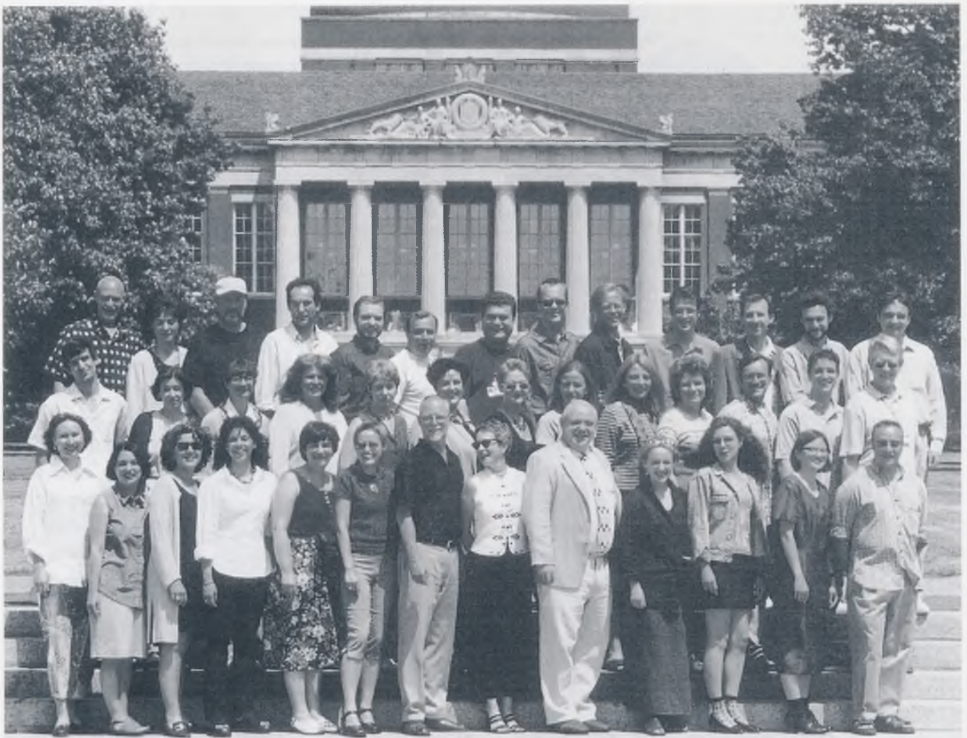
Zajednički snimak međunarodnih sudionika Ljetnog instituta, zajedno s američkim predavačima i organizatorima pred Sveučilišnom knjižnicom u Rochesteru

dijelu tjedna, vodeći diskusiju ili odgovarajući na pitanja vezana uz temu (teme) kojima se bave. 5