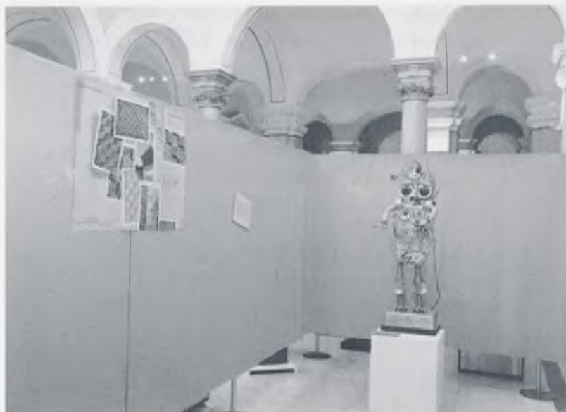
Minotaur našeg doba

Od 9 cjelina najuspjelije su prema mišljenju posjetitelja Čudesa i kurioziteti i Samo za one iznad 18 i one su istodobno dobile i najmanje negativnih ocijena. To možemo komentirati tako da su si posjetitelji poželili upravo takvih, rjeđe izlaganih predmeta i neuobičajenih tema. Najmanje pozitivnih i najviše negativnih ocjena dobio je odjeljak Uh škola , pa se može reći kako su posjetitelji ovu tematsku cjelinu proglasili najlošijom. Kako su i autori upravo njome bili najnezadovoljniji, komentar nije potreban. Još je samo jedna cjelina Ah muškarci na granici negativne ocjene (33 pozitivnih i 28 negativnih mišljenja), što nas je i te kako začudilo. Bili smo uvjereni kako su karakteristike muškaraca, njihove mane i ambicije, njihove sklonosti i poroci, bili izloženim predmetima dobro prezentirani. Sve ostale cjeline dobile su daleko više pozitivnih nego negativnih mišljenja.