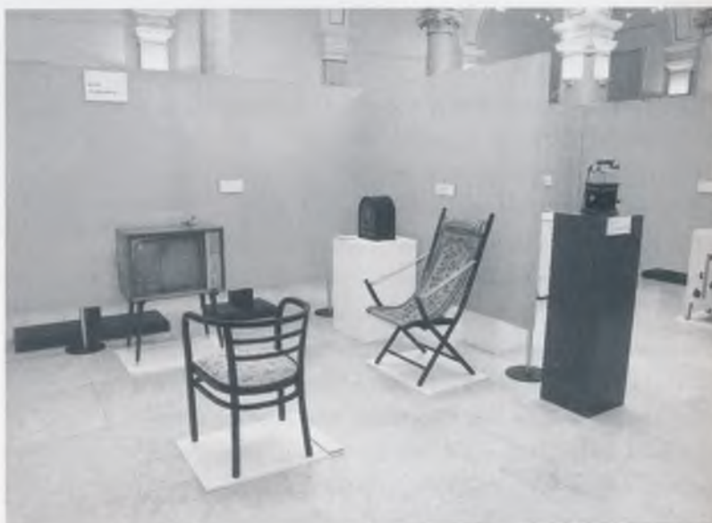
Odjeljak: Dome, slatki dome

Posjetitelji su ispunili 142 anketna listića. Od toga 10 izložbu nije ocijenilo, nego samo komentiralo. Na 4 listića komentar je vrlo pozitivan, dočim je na preostalih 6 neutralan. Negativnog komentara nije bilo. Od 132 preostala listića na 2 je ocjena negativna, na 1 dovoljna, na 15 dobra, a sve ostale se kreću od +3 do +5. Prosječna ocjena izložbe je vrlo visokih 4,4.