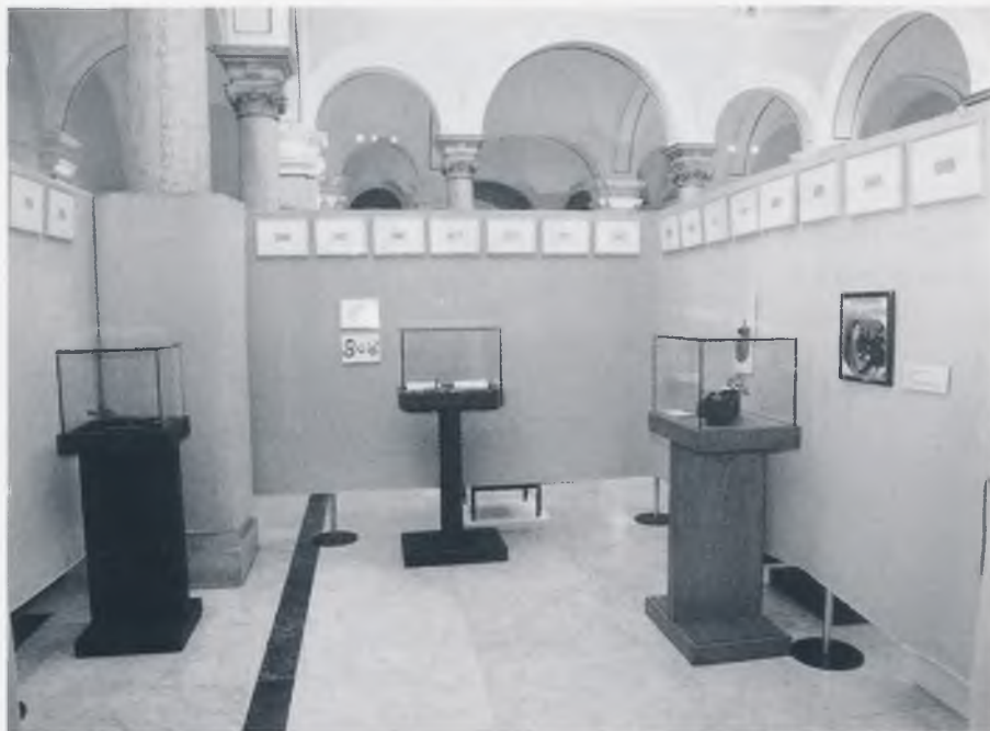
Odjeljak: Sve za put , snimio: S. Szabo

pobuđivali su više pozornosti i mnogi je posjetitelj više puta zavirivao. Znatizelja je ovdje odigrala svoju ulogu. Izložbu smo konceptijski namjerno postavili tako da se omogućiti očitavanje više slojeva, već kako kome odgovara. Neke se više dojmio labirint i sentence koje o njemu govore i koje su u njemu bile postavljene, drugih su se više dojmili svakodnevni predmeti, trećima su se više dopala umjetnička djela, četvrtima bizarnosti, petima nešto peto. Neki su spremno zavirivali kroz otvore i gukerle, a drugi ih nisu ni zamijetili. U svim cjelinama izložbe bili su paralelno i ravnopravno izloženi vrlo stari predmeti sa suvremenim, oni svakodnevne uporabe s umjetninama. Nadamo se kako smo pokazali kako je pažljivim izborom i stvranjem novoga konteksta moguće pomiješati i istodobno izlagati stare rimske zlatne poluge s tramvajskim kartama na kojima je Martinis izveo svoje minijaturne intervencije, ili šiber i stoljećima star šestar, maske suvremenih političara s kuburama ili pak odjeću za purana s damskim gaćama. Moć muzealiziranja koja muzealcima stoji na raspolaganju doista je velika.