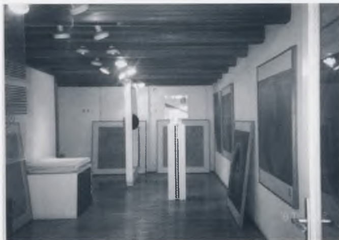
Pogled na prostor Galerije