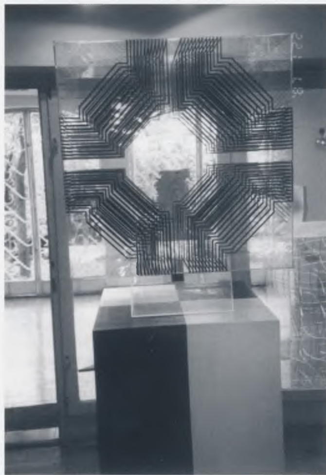
Jedna od "prostornih slika" izloženih u galeriji

1. V. Richter: Sinturbanizam, Mladost, Zagreb 1964., str.21.