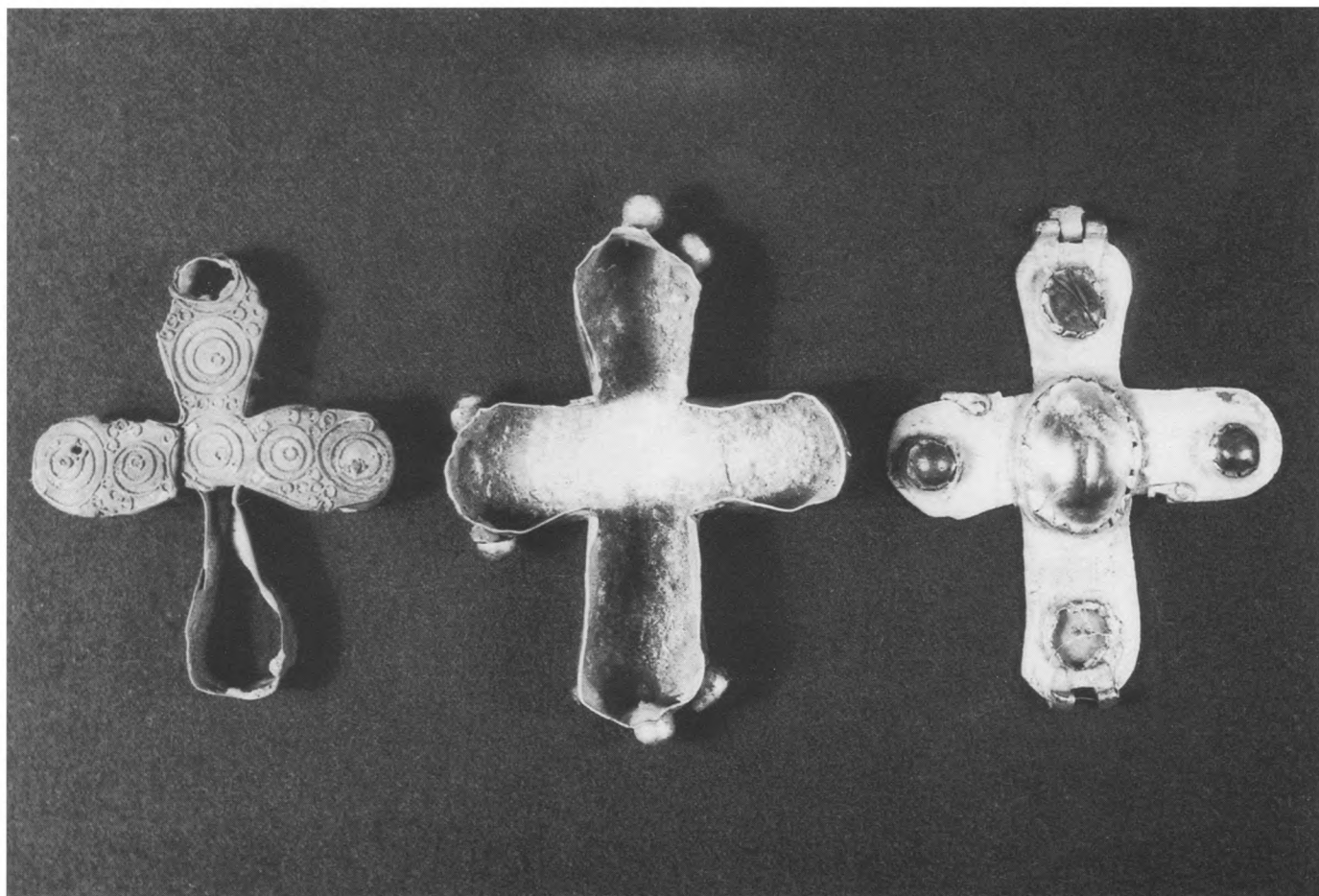
Križ, relikvijar - srebro, pozlačeno, pet ukrasnih kamenova, XII. - XV. st. vlasništvo: Hrvatski povijesni muzej

naših muzealaca i muzeologa, koji su se tada o konkretnom pitanju MRNH i unatoč opcijama ponuđenima od kustosa toga muzeja 3 o transformaciji prema muzeju suvremene povijesti, muzeju rata ili vojnome muzeju, na kraju odlučili za kompromis, a time su se ujedno odlučili za definitivno ukidanje jednog specijaliziranog povijesnog muzeja. 4 U diskurs navedene stručnosti i kolegijalnosti svakako se ubraja još i svima nam poznata šutnja.