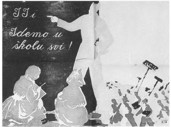
Idemo u školu svi!, nepoznati autor, litografija u tri boje (crna, crvena, zelena), oslobođeni teritorij Hrvatske, 1944. vlasništvo: Hrvatski povijesni muzej

Za vjerodostojan kulturni identitet polazište može biti jedino vjerodostojno istražen muzejski fundus i muzejske pojave, jer u protivnome možemo izmišljati činjenice kako nam padne na pamet.