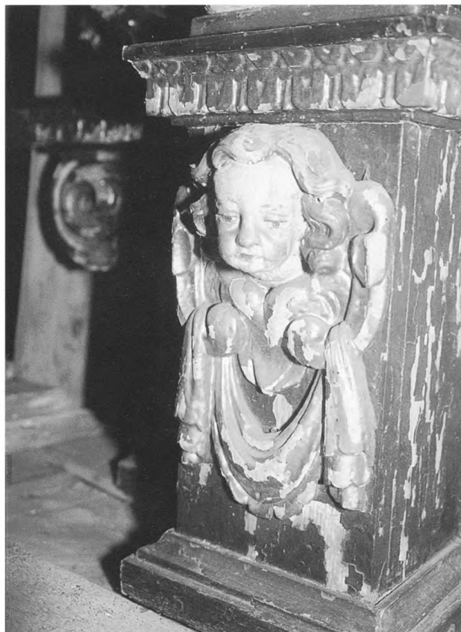
Detalj s oltara, pozlačeno, polikromirano drvo, XVII.st. vlasništvo: Hrvatski povijesni muzej

Primijetila sam da se u godišnjim izvještajima muzeja 11 pod rubrikom “znanstveni rad” može pročitati zaista vrlo široki spektar radova ocijenjenih (ili samoocijenjenih) znanstvenim stupnjem. Sigurno je, međutim, da se između tih tekstova nalaze i oni koji to definitivno nisu (npr. popisi publikacija, sastanci redakcijskih odbora, administrativni spisi itd.) i obratno, da ih ima koji taj stupanj dosežu, a nisu tako verificirani. U tom smislu svakako bi trebalo raditi na ujednačavanju terminologije.