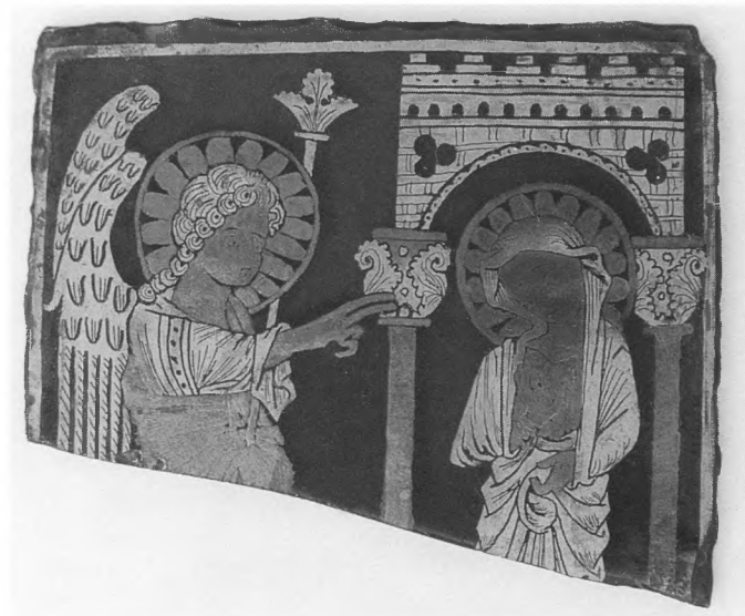
Navještenje, staklena pločica (fragment), XIII. st., slikano zlatnim i srebrnim bojama, vlasništvo: Hrvatski povijesni muzej

zbirki 7 , a druge su skupine, kao napr. Komersteinerovi kipovi, gotički relikvijari iz Grobnika, gotički kalež iz Oštarija, oslikana i posrebrena koža, crkvene zastave i druge teme, našle svoje mjesto u zbornicima i stručnim časopisima 8 .