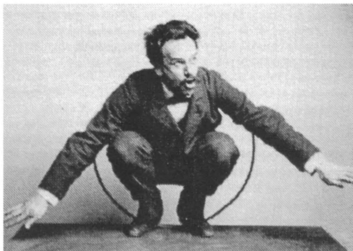
Boas u stavu plesača Kwakiutl, 1895.

Za jednu od njih uzmimo krajnji primjer. Koliko sam pridonio fundusu svojeg muzeja, primjerice, detaljno provjerivši današnje stanje sicanja, tj. tetoviranja u gradskoj okolini? Iako s ljubaznošću svojeg ravnatelja nikad nisam imao problema, dvojim da je kao muzealac mogao biti zadovoljan višednevnim