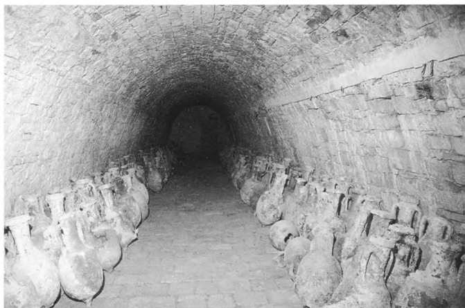
U kazamatima ispod bedema smještene su amfore s podvodnog lokaliteta u uvali Vela Svitnja (Vis), II.stoljeće p.n.e.

Vis – sjedište VŠ NOV i POJ i NKOJ-a”. Prikazivao je povijest otoka od 1921. do 1944. godine s posebnim naglaskom na događaje iz 1944. godine, kada je cijeli Vis bio utvrđena vojna baza. Do 1991. godine djelovao je u sastavu Muzeja revolucije naroda Hrvatske. Nakon integracije MRNH s Povijesnim muzejom Hrvatske i on je postao sastavnim dijelom novoosnovanoga Hrvatskoga povijesnog muzeja.