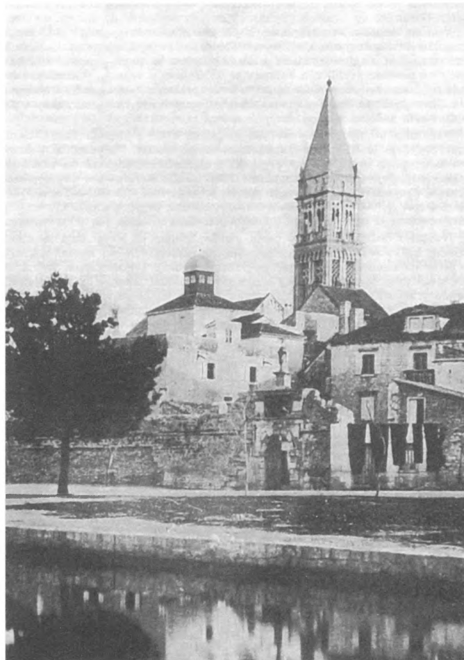
Krovovi na palači Garagnin Fanfogna s početka stoljeća - detalj s kupolicom

Zahvaljujući opet pomoći Ministarstva kulture, i ove godine nastavljamo restauraciju. Na redu je barokno ogledalo. Dokumenti i nacrti u odjelu XIX. st. već dugi niz godina, pojedeni od gagrica, vape za zaštitom, konzervacijom, restauracijom i laminiranjem. Kako su nam sredstva uvijek ograničena, tek ove godine mogli smo započeti sa zaštitnim