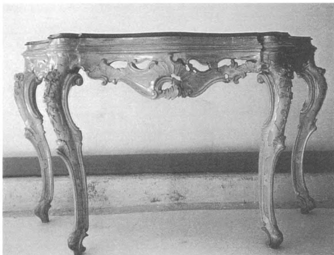
Stolić baroknog ogledala nakon restauracije

u kući Garagnin, jer je gotovo sve odneseno. Garagnini su otišli iz domovine nakon kapitulacije Italije godine 1943. ali namještaj nisu odnijeli sa sobom, nego samo dragocjenosti. Muzej koji se smjestio u njihovoj palači osnovan je godine 1963. Prvi njegovi djelatnici zatekli su onoliko od namještaja koliko je danas. Drugi komad namještaja koji je restauriran — stolić baroknog ogledala, također se spominje u inventaru, ali kako se ogledala navode gotovo u svakoj prostoriji, nije poznato u kojoj se prostoriji nalazio. U Muzeju su stalno izložena 3 barokna ogledala sa stolićem, dva u stalnom postavu, jedan u hodniku koji vodi u uredske prostorije, te još jedan okvir ogledala u skladišnom prostoru.