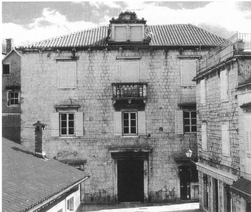
Dio muzejskih krovova danas snimio: Zoran Alajbeg

1987. godine, isto kao i dva manja na susjednim zgradama. Prije nekoliko godina sanirana je krovna konstrukcija na manjem krovu gdje je ulaz u Muzej, koji je prokišnjavao. Također, već sljedeće godine na dijelu zgrade čiji je prizemni dio uređen za depo lapidarija, a gornji dio za uredski prostor, te malu knjižnicu, s primjerenim WC-om. Depo muzeja koji je uredila autorica ovoga teksta, izgleda tako da su kronološkim redom postavljene lapide na drvenim policama uzduž zidova prostora. Rad zainteresiranima je u njemu moguć. Izlivena su i dvije velike betonske kamenice za pranje keramičkih ulomaka. Ove godine saniran je krov na novijoj zgradi, baroknih obilježja u kojoj su uredske prostorije te vrijedna knjižnica Garagnin Fanfogna. Radovi pri izmjeni su se jako odužili zbog kiše, s napomenom da zgrada nema betonske međukatne konstrukcije nego naravno, drvene, tako je u tom vremenu bio stalno prisutan strah od prokišnjavaanja i štete. Tom prigodom popravljena su dva oštećena luminarija na njima. Nakon toga uslijedila je izmjena krovne konstrukcije i postavljanje novih kupa kanalica na još četiri manja krovića u dijelu muzeja u kojemu je stalni postav, čija zgrada nosi stilska obilježja od romanike do baroka. Tijekom jeseni saniran je posljednji oštećeni krov u starijem dijelu zgrade na kojem se još početkom XX. stoljeća mogla uočiti kupolica. Otkrivanjem krova otkrivene