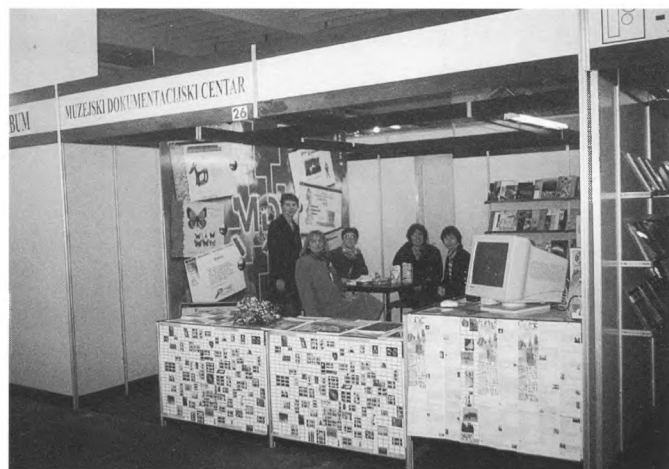
Pogled na MDC-ov štand, Interliber 1998.

Iscrpan registar ratnih šteta nastalih tijekom Domovinskog rata sadržan je u publikaciji MDC-a Ratne štete na muzejima i