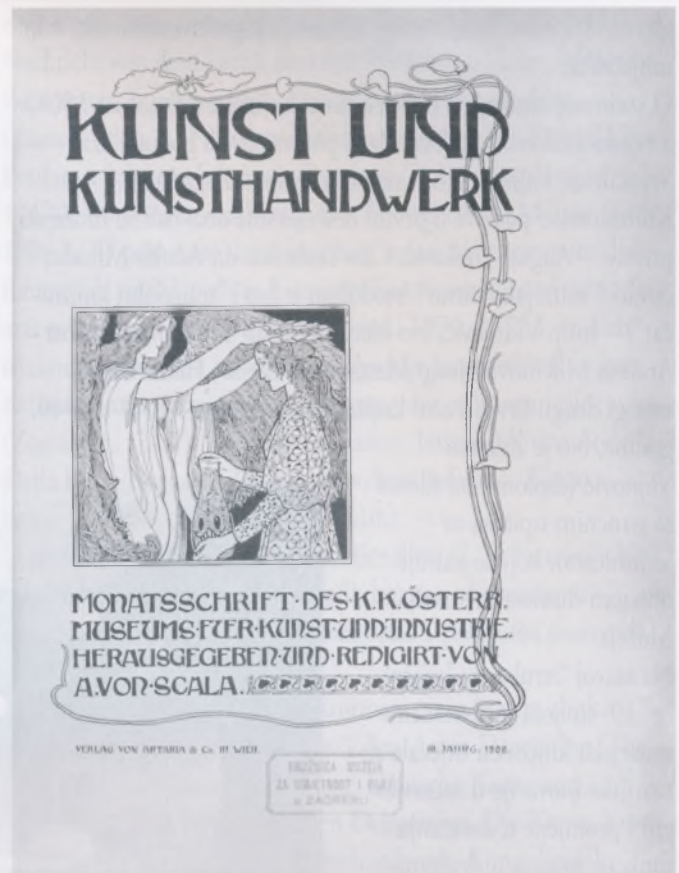
Naslovnica knjige Umjetnost i umjetnički obrt , Beč, 1900. god.

From the initial collection of the library of the Art Society, through planned acquisitions, valuable donations and purchases, an