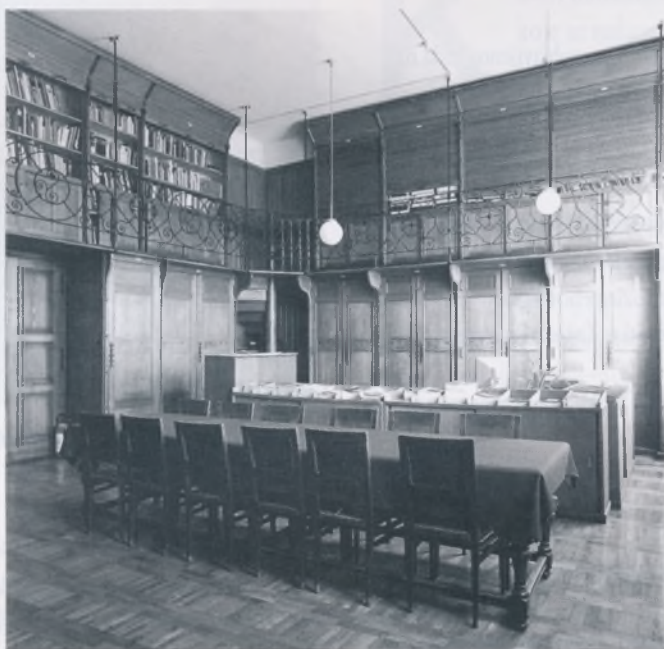
Unutrašnjost knjižnice Muzeja za umjetnost i obrt prema nacrtu Hermana Bolléa

Noviji dio knjižničnog fonda klasificira se po UDK (Univerzalnoj decimalnoj klasifikaciji) i katalogizira u programu CROLIST. Radi se i na reklasifikaciji i rekatalogizaciji starijeg fonda, te na analitičkoj obradi časopisa. Uz postojeće stare kataloge na listićima, formiran je i novi abecedni, naslovni i topografski katalog, te kartoteka predmetnih odrednica (u nedostatku normativne datoteke i tezaurusa koriste se slobodno oblikovane predmetnice). Prema rezultatima revizije provedene 1990. – 1991., kompletan inventar knjižnice upisan je u računalo i vodi se usporedo s klasičnim inventarom.