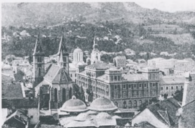
Zemaljski muzej – zgrada penzionog fonda

Franje Jukića, koju on objavljuje u svom časopisu "Bosanski prijatelj". Želeći zaštititi bosanske spomenike on piše: "Poznato je svima kod nas, kako se u Bosni starinske stvari: novci, kamenje, pečati itd. nalaze i pohlepnim inostrancima u malu cijenu prodaju... Ja samo od nekoliko godina počeo takve stvari sabirati, zato molim sve Bošnjake gdje što god opaze, da otkupe na moje ime. Ako Bog da, s mojom zbirkom želim metnuti početak bosanskom muzeu." 1 Ova ideja predstavljala je prvu