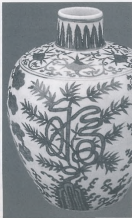
Keramička vaza iz 18. stoljeća, oslikana Qinguaci tehnikom, bijelo-plavo koja potječe iz Dinastije Qing.

prve knjige na tim prostorima, pročitati o nastanku književnosti i najpoznatijim kineskim literatima.