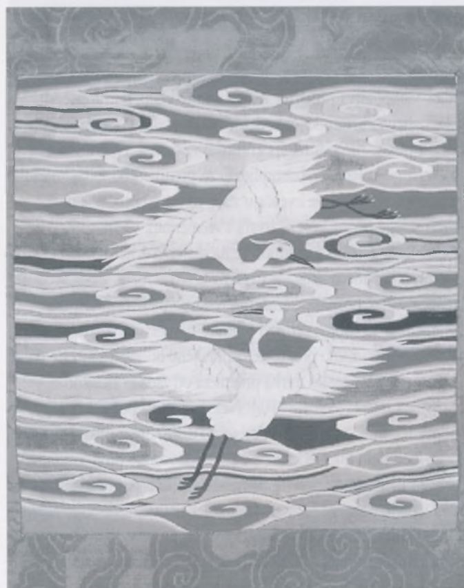
Ovaj tradicionalni kineski tepih pripada Chaozhou kineskoj tradiciji. Ždralovi po kineskoj mitologiji simboliziraju odanost i vjernost.

Postav Književnosti bavi se čitavom rekonstrukcijom pisane riječi u Kineza. Od školstva i njegova značenja za kulturu i društvo do razvoja književnosti kroz kinesku povijest i njene utjecaje na pisanu riječ. Možete naučiti o imperijalnom ispitivačkom sistemu školstva, vidjeti uniforme kineskih školaraca, proučiti