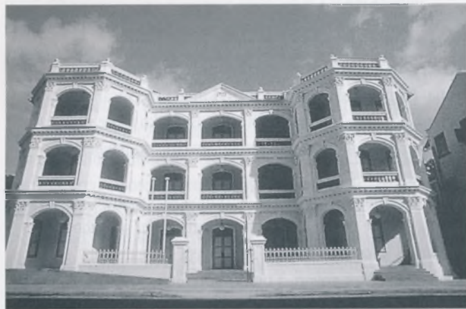
Zgrada Muzeja azijske civilizacije, prvo krilo smješteno u staroj školi poznate Singaporske dinastije Tao Nan

Singapore nam u svojoj raznolikosti kreativnih sadržaja nudi takozvani presjek nacionalne kulturno-povijesne baštine cijele Azije. Uglavnom su to muzeji, galerije i radionice vezane uz umjetnost, povijest i kulturu Singapura, Malezije, Indije i Kine. Godine 1993. osnovano je Društvo za zaštitu nacionalne kulturne baštine i njegova zadaća je sačuvati povijest triju naroda koji žive u Singapuru; Malezijci, Indijci i Kinezi. Društvo egzistira unutar Ministarstva informacija i umjetnosti, a dvije središnje ustanove koje su zadužene za razvoj i napredak toga društva su Narodni arhiv Singapura i Nacionalni muzej Singapura. Narodni arhiv Singapura zadužen je za edukacijske i kulturne sadržaje, dok se Nacionalni muzej Singapura bavi isključivo muzejskom i povijesnom tematikom. Neki od važnijih