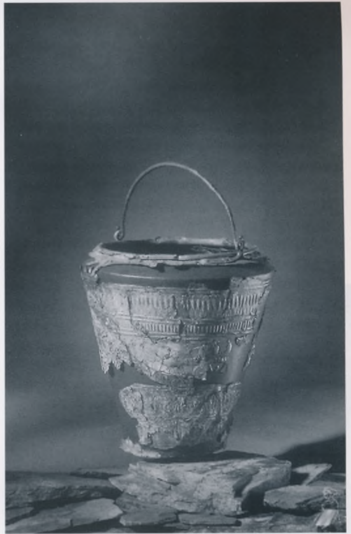
Brončana figuralno ukrašena situla nalazište Novo Mesto – Kapitelska njiva oko 400. god. p. n. e. – starije željezno doba

Zbog značajnosti samih nalaza te zaslužnost arheologije za grad i širu publiku, Muzej se odlučio za široku promociju izložbe. Pripremili smo veliku količinu popratnog materijala, što do sada nismo običavali raditi. Prije otvorenja izložbe tiskali smo četiri plakata, dva prospekta na pet jezika, četiri nove kopije arheoloških predmeta – nakita s certifikatom, tri grafike s prikazima koji su skinuti sa situla, koji su ujedno i znak izložbe,