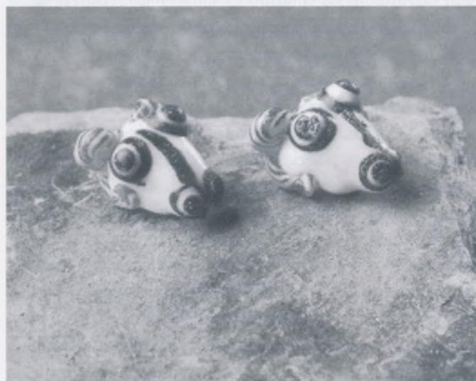
Staklene perle u obliku ovnovih glava nalazište Novo Mesto – Kapiteljska njiva; 4.-5. st. p.n.e. – starije željezno doba