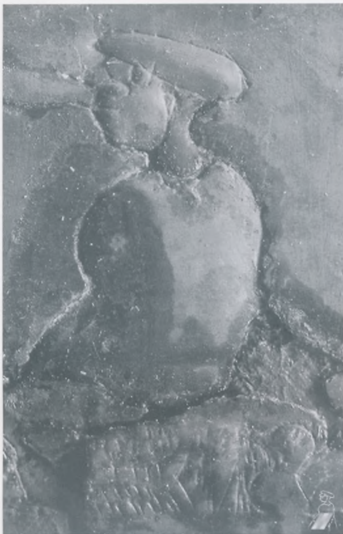
Figuralno ukrašena situla – detalj nalazište Novo Mesto – Kapiteljska njiva oko 400. god. p. n. e. – starije željezno doba

Cjelokupan projekt Kapiteljska Njiva Novo Mesto vodio se pod visokim pokroviteljstvom predsjednika Republike Slovenije, Milana Kučana, koji je izložbu službeno otvorio. Ministarstvo kulture Republike Slovenije je zajedno s Upravom za kulturnu baštinu Republike Slovenije, Gradskom općinom Novo Mesto te velikim brojem sponzora (ukupno dvadeset i dva uglavnom iz Novog Mesta) financijski su omogućili realizaciju cjelokupnog projekta. Uz tu podršku i pomoć bili smo u mogućnosti ostvariti cjelokupni projekt, počevši od polaznih zamisli i ideja, koje smo zacrtali još u pripreмноj fazi: autor Boris Križ, dizajner Jovo Grobovšek te vođa projekta Zdenko Picelj, a čije ostvarenje je naravno ovisilo o raspoloživim financijskim sredstvima.