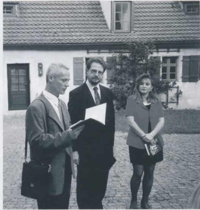
Savjetnik za kulturu Republike Hrvatske u Münchenu otvara izložbu "Krapina – svijet neandertalca" u Tüchersfeldu.

Ovakav zajednički projekt također potiče razmišljanja i o načinima buduće suradnje kao i o uključivanju drugih muzeja šire regije u slične projekte, čemu kolege iz Bavarske pružaju veliku potporu. Nadamo se da skromna financijska sredstva neće biti zapreka da se takve zamisli i realiziraju. Naš primjer razmjene pokazuje kako se i na skromniji način može uspostaviti dobra suradnja – naime, odjek izložaba bio je dobar i među