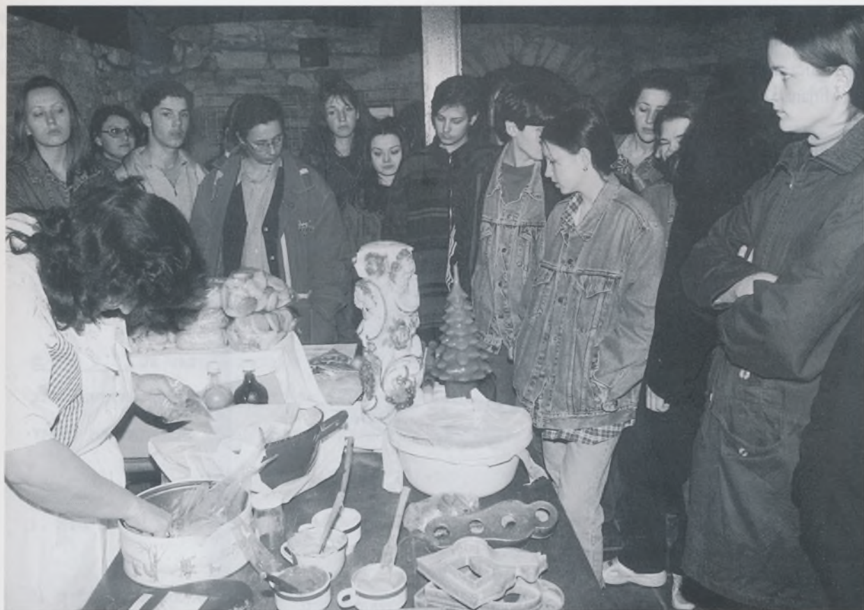
Rad licitara, popratni program uz izložbu Tradicijski obrti i rukotvorstvo Organizacija: Etnografski odjel GMV-a.

srodnih sadržaja uz pojedine programe poput starih obrta u povodu izložbe “Tradicijski obrti i rukotvorstvo – entitet hrvatske narodne baštine”.