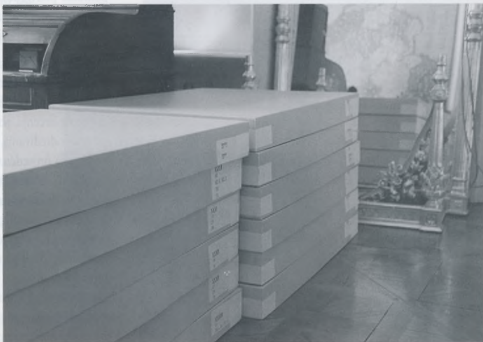
Dijecesanski muzej Zagrebačke nadbiskupije, pohrana dvjestotinjak primjeraka misnog ruha u kutije od bezkiselinske valovite ljepenke, u privremenom prostoru

bilježenje predmeta, njihovo slaganje, odvajanje i kartotečno praćenje važnih podataka o njima. Činjenica da Muzej ne postoji u smislu prostorne prezentacije, te da je i prostor za pohranu tek u procesu rješavanja, čini konzervatorske zahtjeve spram zbirke misnog ruha složenijima i, istodobno, principijelnima. Suradnja s privatnom restauratorskom radionicom "Lorelei-Art" u tom je smislu postigla višestruke rezultate. Principijelno je polaziste, podjednako dokumentacijske, kataloške i one "fizičke" inventarizacije – povijesni spomenik, u svojoj ukupnoj povijesnoj slojevitosti, bez apriornog i estetskog vrednovanja. Naime, kao što je osnovna dokumentacija u crno-bijeloj i kolor fotografiji pratila detalje tkanja, oštećenja prednje i stražnje strane, a katalog u dva toma ("Dijecesanski muzej Zagrebačke nadbiskupije, Zbirka misnog ruha", Zagreb, listopad 1997., u