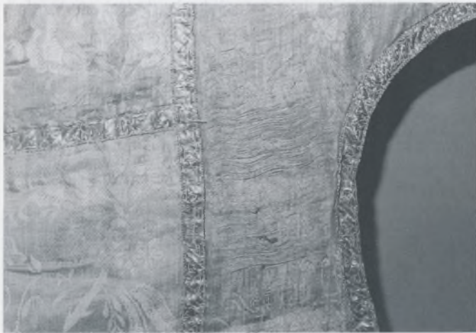
Dalmatika br. 67.a, prednja strana, detalji oštećenja zabilježeni tijekom predistraživanja

poštivanja povijesnog spomenika, čiji su slojevi u tekstilnome primjerku transparentni u estetskome smislu, manifestiran je u radovima na odabranim paramentima iz zbirke. Simultano pokazati rezultate uobičajenog, na rastavljanje i čišćenje usmjerenog pristupa i onog na spomenik koncentriranoga, uspjelo je restauratorici zahvaljujući spremnosti na