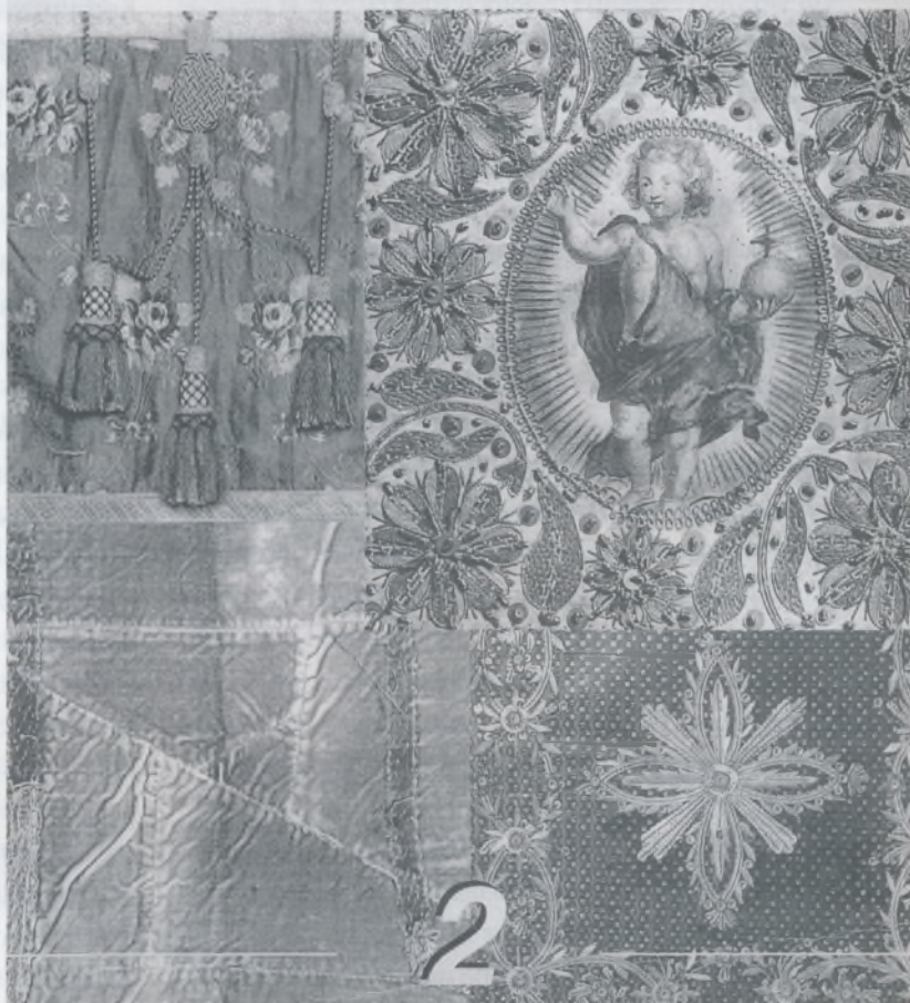
Naslovnica II. toma jednog od dva primjerka kataloga Zbirke misnog ruha Dijecezanskog muzeja Zagrebačke nadbiskupije

Ministarstvo kulture Uprava za zaštitu kulturne i prirodne baštine