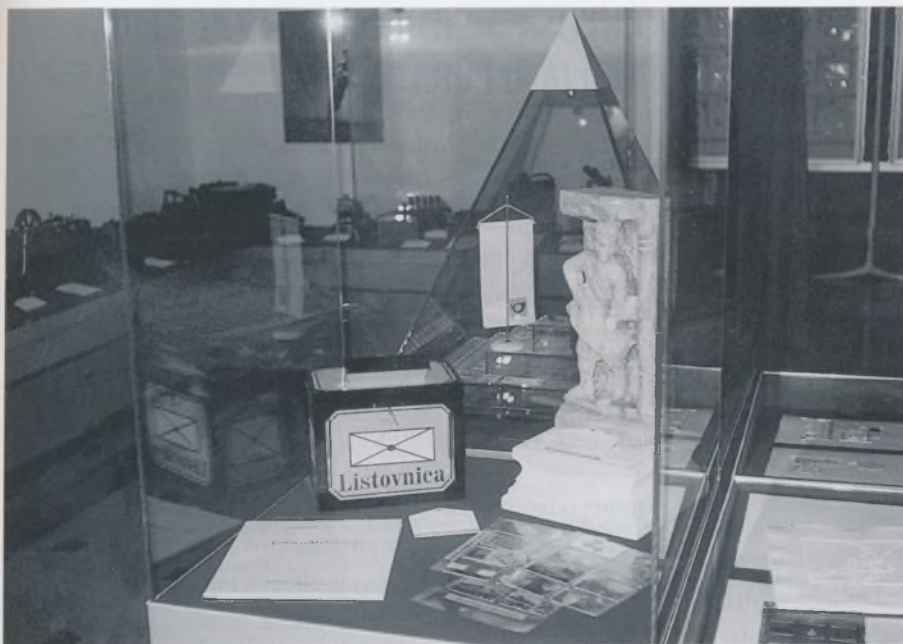
Eksponati HPT muzeja: Trogirski glasnik iz 13. st. (replika); poštanska listovnica iz Trakošćana, početak 20. st. (replika); telefonske kartice izdanja HPT-a; prigodni album poštanske marke "Pastoralni pohod svetog oca Ivana Pavla II Zagrebu i Hrvatskoj" izdanje HPT-a 1994.

naznačuju važne trenutke davne i nedavne hrvatske povijesti, a govore i o ljepoti hrvatske zemlje, kulture i umjetnosti. Na svečanom otvorenju Muzeja pošte i telegrafa Srednje Europe, g. Enzo Cardi rekao je da su u postavu Muzeja prisutni muzeji iz šest zemalja Srednje Europe, u kojima je duga tradicija postojanja poštanske službe, pa je ponos i čast talijanske pošte da "memorija" poštanske organizacije Srednje Europe ima sjedište u jednom talijanskom gradu. Uspostava ovog muzeja u Trstu osvjedočenje je velike zajedničke iznadnacionalne tradicije različitih sredina, a ta je činjenica danas nedjeljiva osnova ujedinjene Europe.