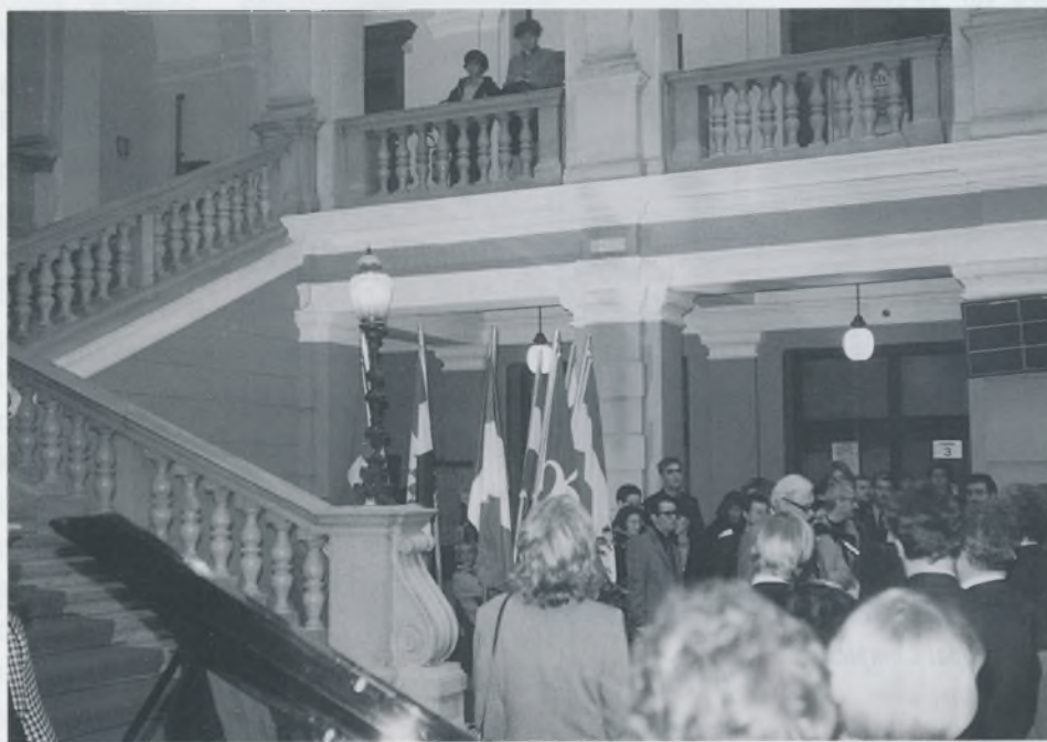
Svečano otvorenje Muzeja pošte i telegrafa Srednje Europe 28.11.1997. u auli reprezentativne Palače pošte u Trstu.