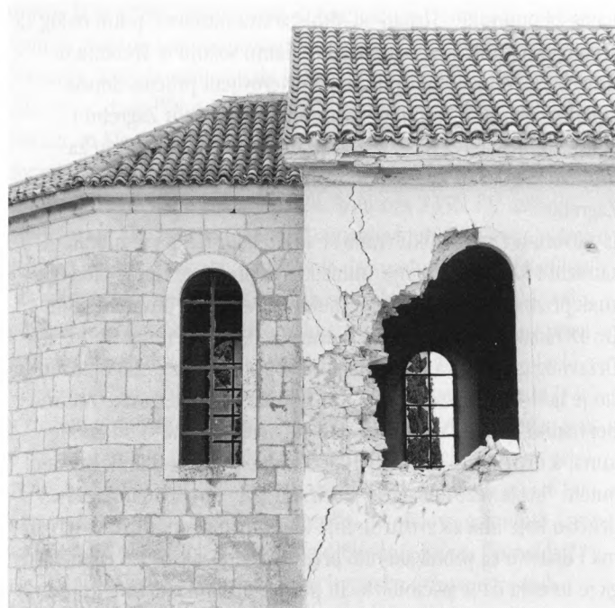
Konjeverate kod Šibenika, veljača 1992.

U okviru fotografskog programa Male galerije, u Cankarjevu domu otvorili su izložbu zagrebačkog fotografa Damira Fabijanića o uništavanju kulturne baštine u Hrvatskoj. Fabijanić je već dulje od deset godina eminentno prisutan na hrvatskoj oblikovnoj stvaralačkoj sceni kao fotograf arhitekture i industrijskog obliko- vanja. Iz njegova jako bogatog curriculuma istaknut ćemo samo dva recentna podatka: za svoje djelo Fabijanić je dobio veliku nagradu posljednjeg Zagrebačkog salona, koja predstavlja najveće priznanje na području likovne umjetnosti i oblikovanja u Hrvatskoj, a njegovu međunarodnu reputaciju utvrdio je poznati pariški nakladnik Marval, koji je Fabijanićeve monografsku knjigu