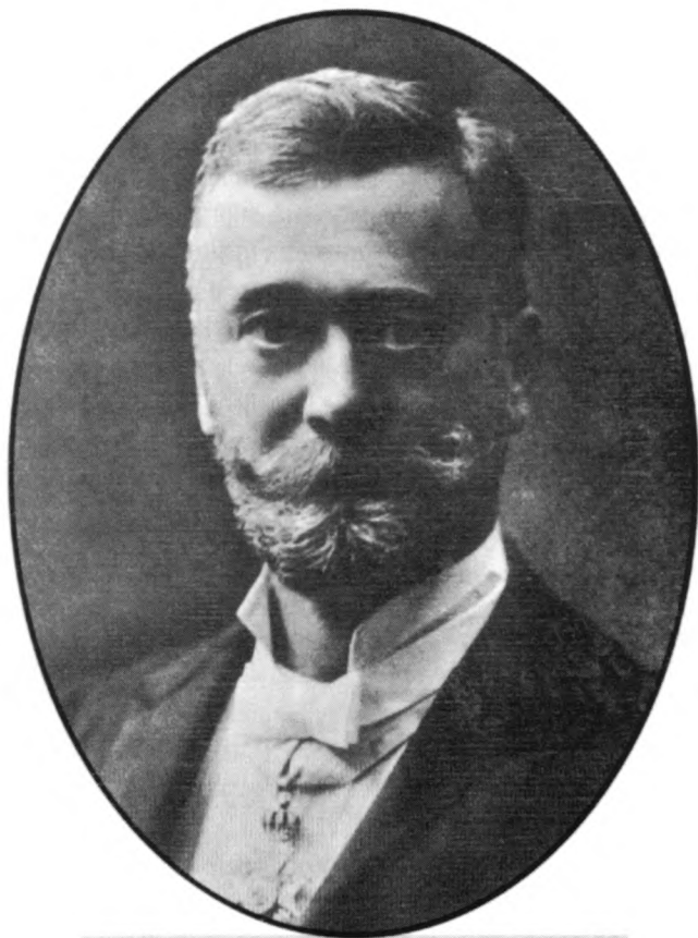
Dvorski savjetnik Prof. Dr. Karlo Gorjanović Kramberger ravnatelj geolog. paleontolog. narodn. muzeja predsjednik geološkog povjerenstva za kraljevinu Hrvatsku i Slavoniju