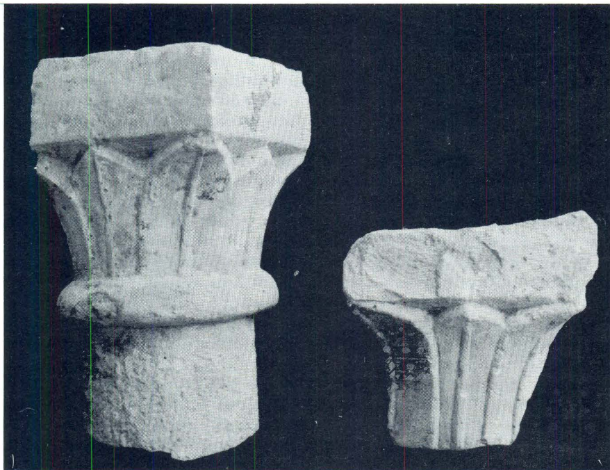
Novootkriveni kapiteli iz Trogira

tastu dekoraciju predromaničkih spomenika, ipak je dosta indikativna za stilsko-kronološku valorizaciju, budući je motiv pereca jedan od najfrekventnijih u ornamentalnom repertoaru predromaničke umjetnosti. S druge pak strane, predromaničke tranzene na našoj obali u pravilu nisu imale tu kompoziciju. Dominiraju jednostavnije geometrijske mreže, mahom neukrašene, koje se vežu na starije uzore i predloške iz starokršćanske epohe. Direktne analogije za trogirski primjerak nalaze