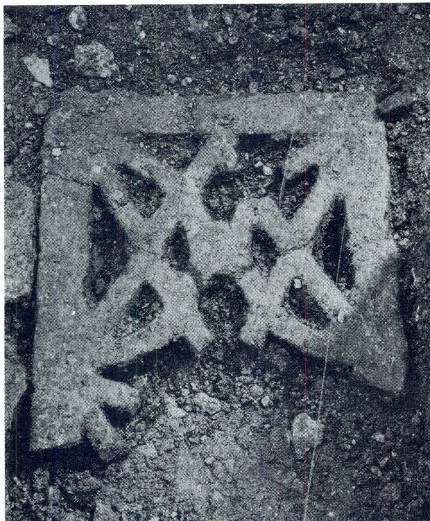
Novootkrivena trogirski tranzena u trenutku nalaza