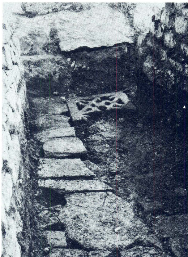
Novootkrivena trogirski tranzena u trenutku nalaza

fragmentarna romaničko-gotička kapitela. Jedan je gotovo čitav, dok je od drugoga sačuvan manji ulomak istih stilskih odlika. S obzirom na karakter nalazišta u jezgri grada, gdje život i danas traje, nije moguće utvrditi precizniju stratigrafiju. Stariji slojevi su većim dijelom poremećeni masivnim i dubokim temeljima novijih zdanja, pa je i materijal više užih faza pomiješan. Okvirno se sloj, u kojemu su nađeni kapiteli, pruža u okomitoj stratigrafiji od barokne podnice od crvene zemlje