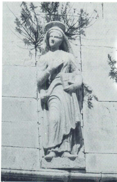
Pag, Zborna crkva, reljef Bogorodice