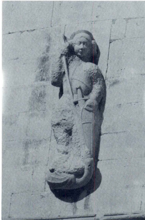
Pag, Zborna crkva, reljef Sv. Jurja