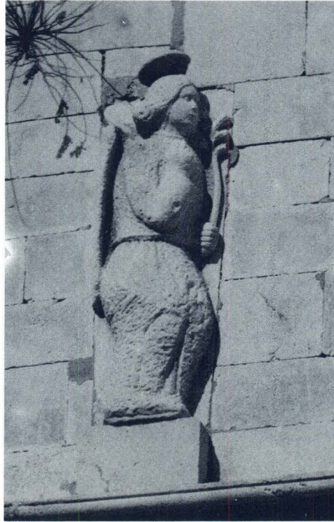
Pag, Zborna crkva, reljef anđela Gabrijela

godina nakon posvećenja 14 izgradnja još bila u toj fazi. Puno je vjerojatnije da je tada, a to je vidljivo i iz spora s Jurjevim sinom, bilo u toku dovršavanje pročelja.