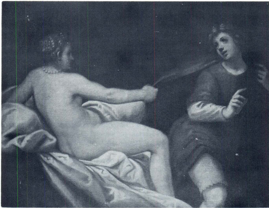
Andrija Medulić, Josip i Putifarka, Zagreb, Galerija Benko Horvat

U spomenutoj, međutim, recenziji Paole Rossi nalazimo ogradu od našeg „Blagoslova Jakobova” iz Strossmayerove galerije, budući da je poznaje samo iz reprodukcije. Slika je nabavljena mojim zalaganjem 50-tih godina od Calligarisa (Terzo d’Aquila), a i objavljena je čak u mojoj knjizi „Stari majstori u Jugoslaviji” I, 1964. Riječ je očito o varijanti (58 x 115 cm), dakle ne običnoj replici. Slikana je na platnu, i, premda je znatno prepatila i bila restaurirana, njena je slikarska kvaliteta nesumnjiva.