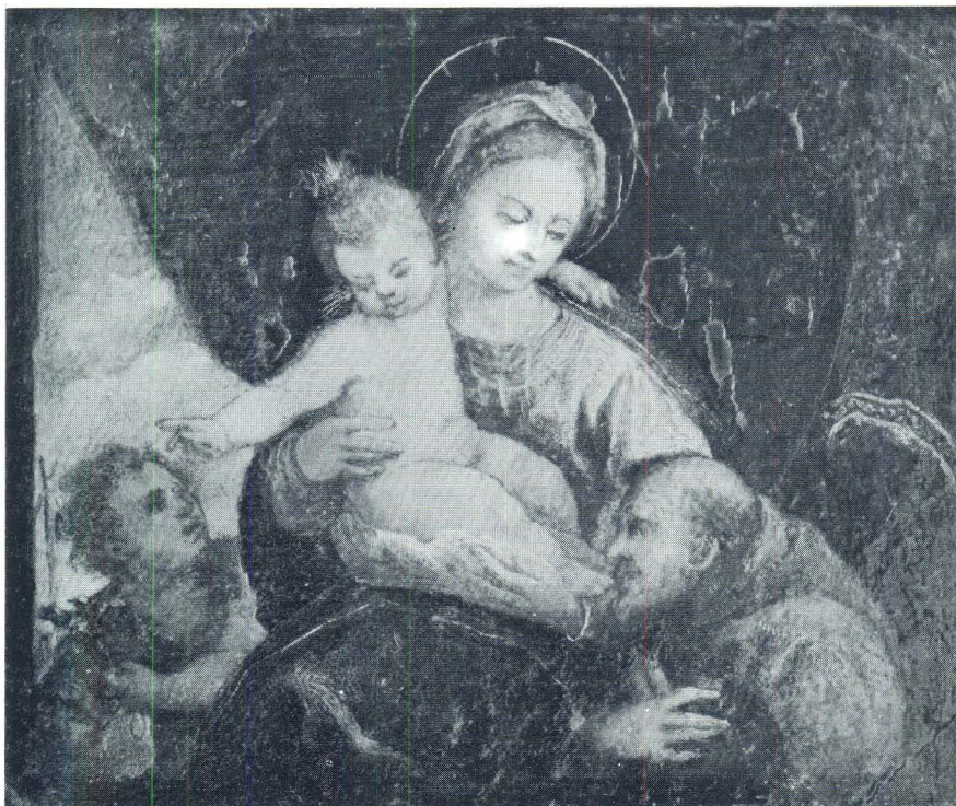
Andrija Medulić, Bogorodica sa djetetom, Sv. Ivanom Krsiteljem i donatorom, Zagreb, Strossmayerova galerija