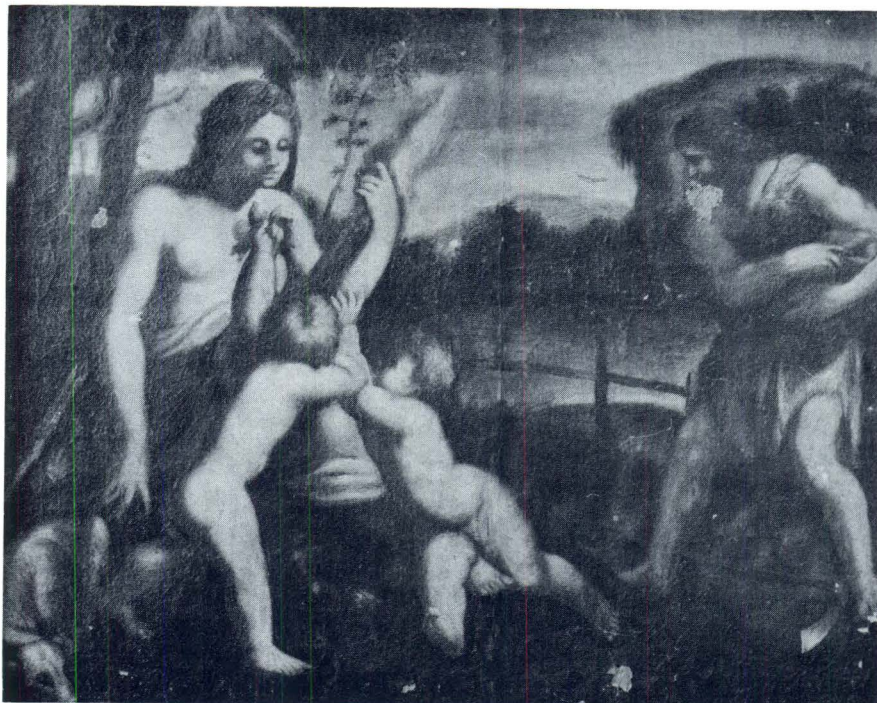
Andrija Medulić, Filomen i Baukida, Rijeka, privatno vlasništvo