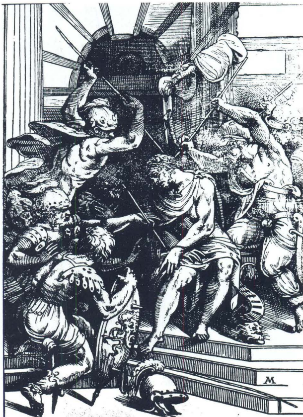
Majstor Triptiha Sv. Martina, Krunjenje trnovom krunom, Venecija, nekad zbirka Sonino

smatraju izvornim Medulićevim djelom. Rosand i Muraro, naprotiv, originalom smatraju monogramiranu verziju objavljenu od Richardsona. Ali bez obzira na tu kontroverzu, možda je vrijedno ovom prilikom objaviti „Krunjenje trnovom krunom” (52x49), nekad u zbirci Sonino (Venecija), rađeno prema berlinskom drvorezu, ali sa znatnim preinakama. Ono se zato u mnogočemu i razlikuje od monogramiranog drvoreza. Prema Richardsonu ovaj Medulićev drvorez rađen je kao slobodna varijacija poznatog Ticianovog „Krunjenja trnovom krunom” u Louvreu uz postojeću mogućnost da su i drvorez i slika iz zbirke Sonino nastale prema nekom drugom predlošku. Ova posljednja, naime, nije slikana u inverziji.