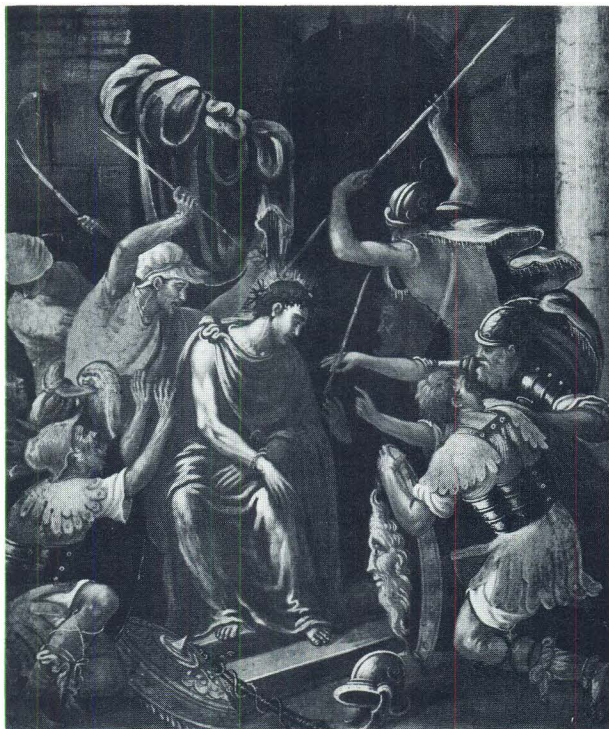
Andrija Medulić, Krunjenje trnovom krunom, drvorez po Ticianu

cibtrasta proprio con l'aggancio parmigianinesco che rivela un punto di partenza 'moderno' di matrice manieristica. . ." 8