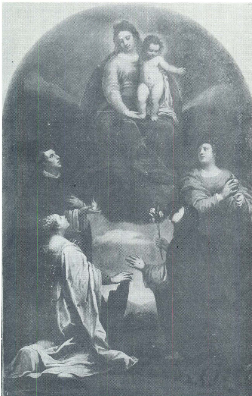
Filippo Zanicchi, Bogorodica s Djetetom, Sv. Katarinom Aleksandrijskom, Sv. Katarinom Sijenskom, Sv. Marijom Magdalenom i Sv. Vinkom Fererskim, Šibenik, Crkva sv. Dominika