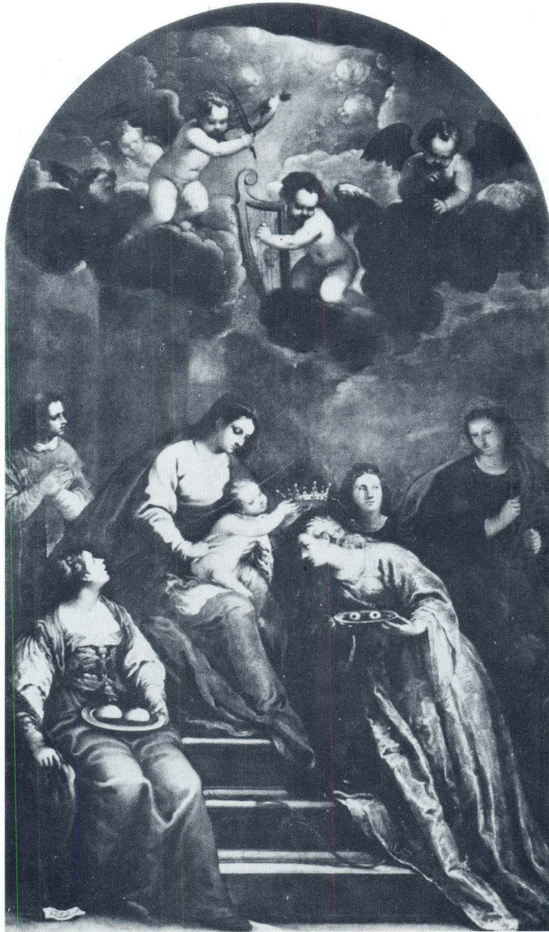
Filippo Zaniiberti, Bogorodica s Djetetom, sa Sv. Agatom i drugim svecima, Castelcucco (Treviso), crkva sv. Lucije