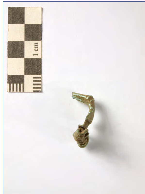
Slika 13, 14. Snažno profilirana fibula, kat. br. 7 Figure 13, 14. Kraftig profilierte fibula, cat. no. 7