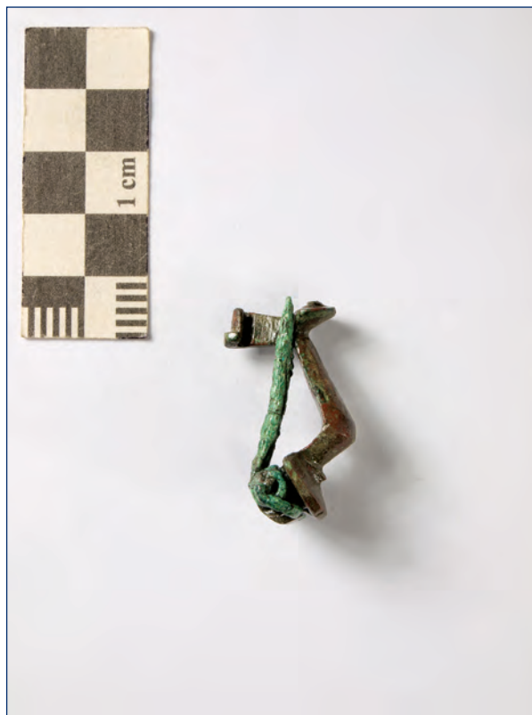
Slika 25, 26. Koljenasta fibula, kat. br. 13 Figure 25, 26. Knee fibula, cat. no. 13