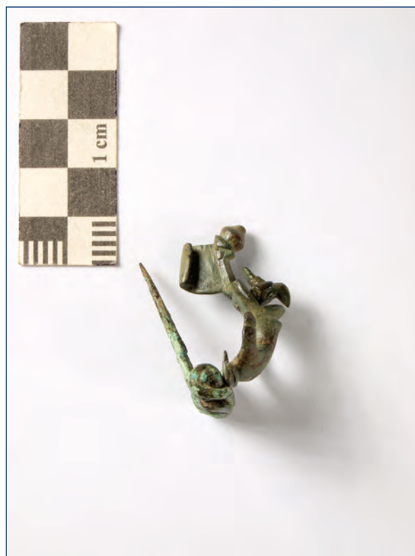
Slika 21, 22. Sidrasta fibula, kat. br. 11