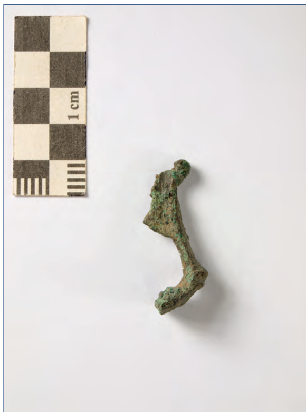
Slika 5, 6. Snažno profilirana fibula, kat. br. 3