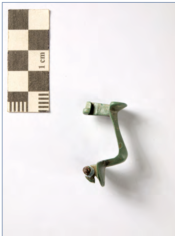
Slika 27, 28. Koljenasta fibula, kat. br. 14 Figure 27, 28. Knee fibula, cat. no. 14