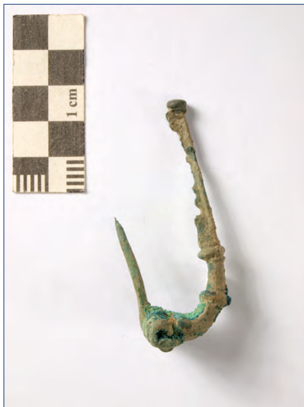
Slika 1, 2. Fibula s dva diska na luku i perforiranim držačem, kat. br. 1