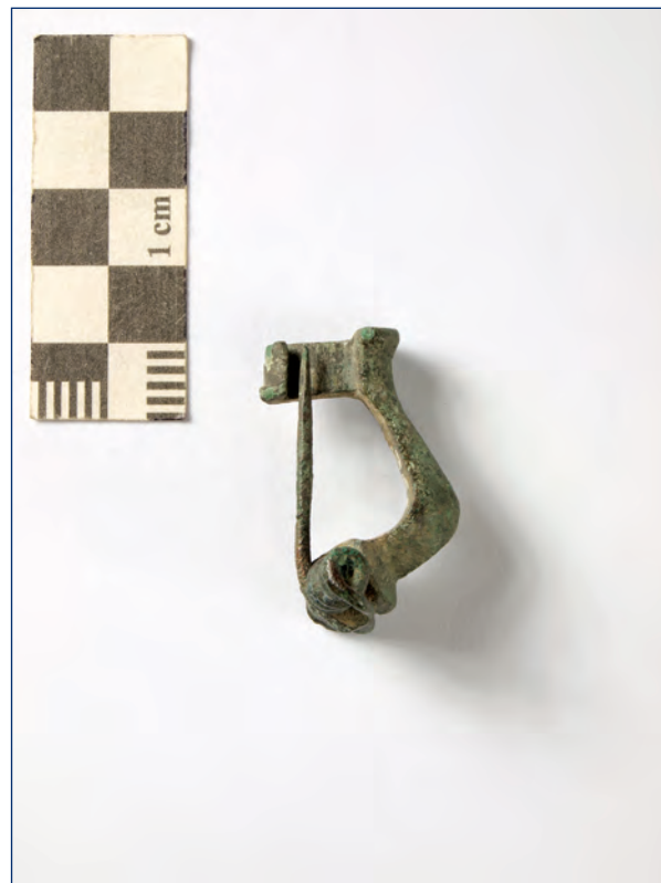
Slika 23, 24. Koljenasta fibula, kat. br. 12 (snimio: D. Fajdetić, 2012.) Figure 23, 24. Knee fibula, cat. no. 12 (Photo by: D. Fajdetić, 2012.)

nađen na brodskom Trgu Ivane Brlić-Mažuranić (karta 1, 3), a u treću donjoandrijevačka fibula (kat. br. 14). Prvu varijantu karakterizira fasetirano tijelo i većim dijelom ogoljena spirala, kakvu ima zasad samo još jedan siscijski primjerak (Koščević, T. XXII, 173) koji se od naše razlikuje po tome što