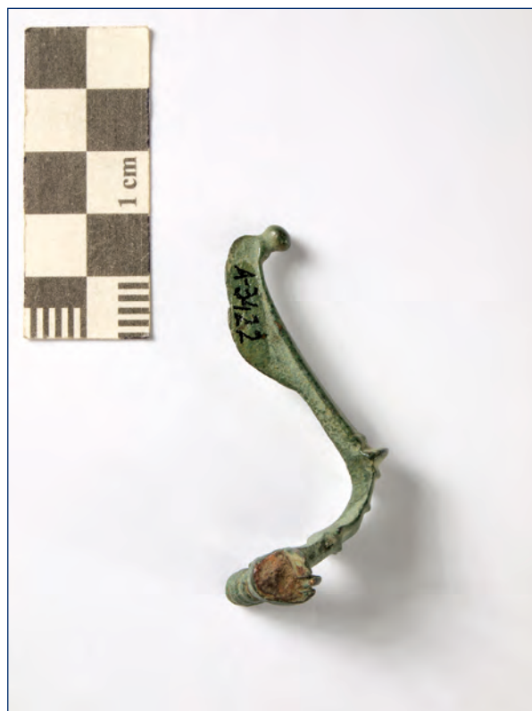
Slika 9, 10. Snažno profilirana fibula, kat. br. 5