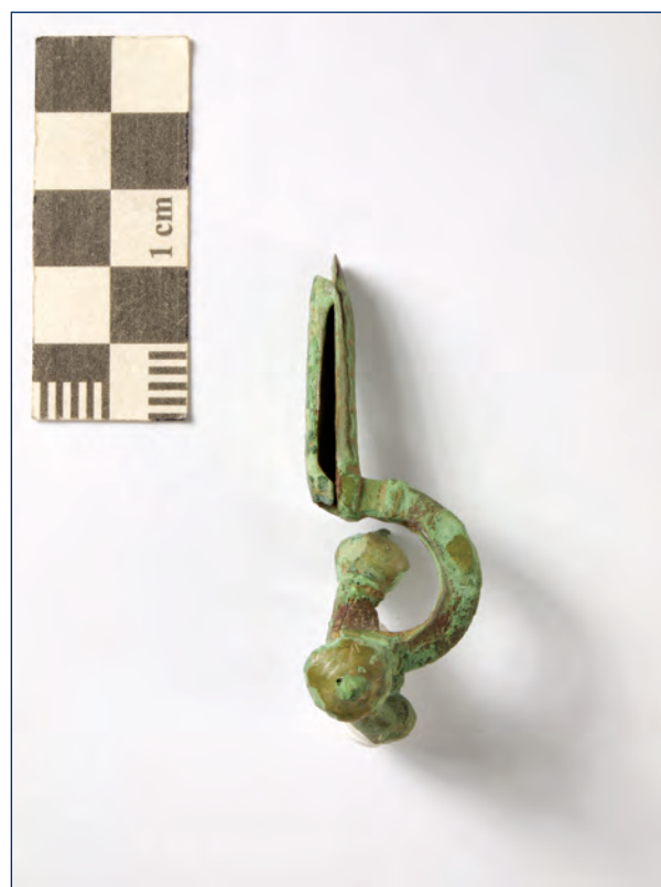
Slika 31, 32. Lukovičasta fibula, kat. br. 16