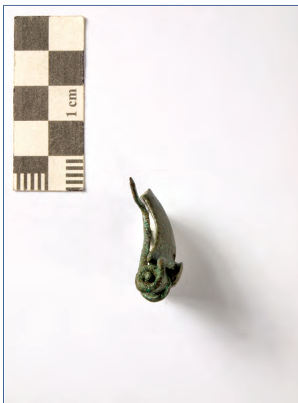
Slika 15, 16. Snažno profilirana fibula, kat. br. 8