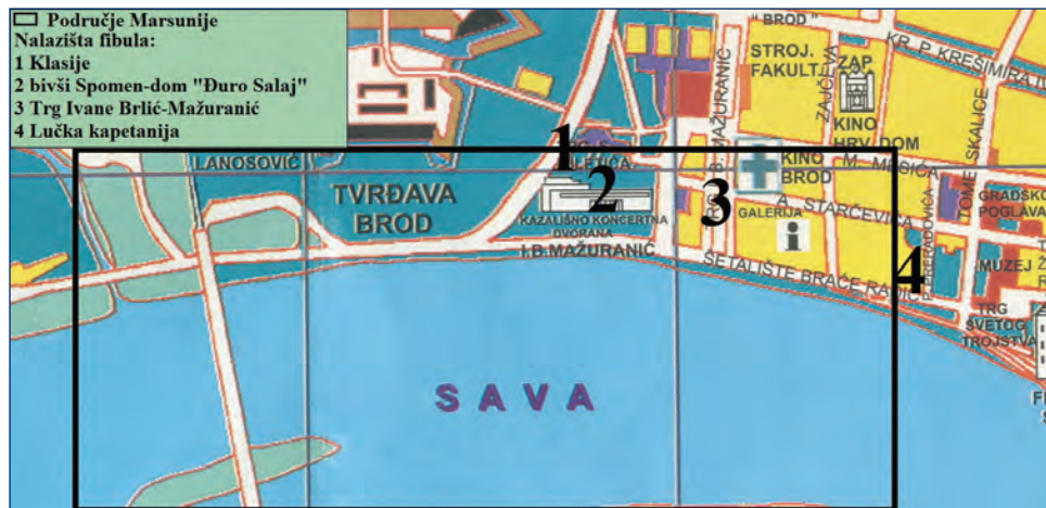
Karta 1. Slavonski Brod, uži centar grada (Plan grada: Slavonski Brod, izdavač: Turistička zajednica grada Slavenskog Broda, Slavonski Brod 1997. Preuredio: autor, 2012.)

Map 1: Slavonski Brod, inner city center (City plan: Slavonski Brod, publisher: Turistička zajednica grada Slavenskog Broda, Slavonski Brod 1997. Redone by: I. Artuković, 2012.)