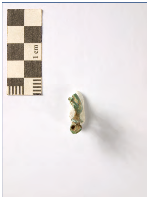
Slika 17, 18. Sidrasta fibula, kat. br. 9