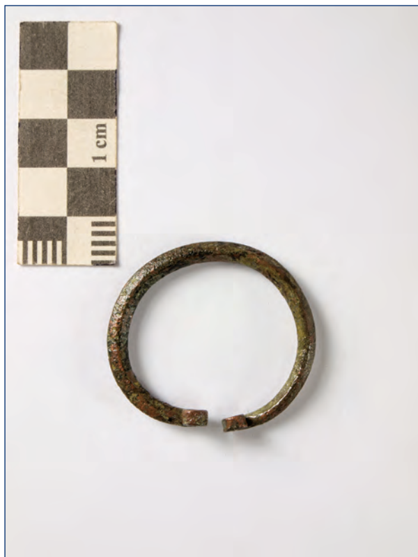
Slika 33. Prstenasta fibula otvorenih krajeva, kat. br. 17