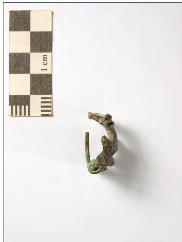
Slika 19, 20. Sidrasta fibula, kat. br. 10