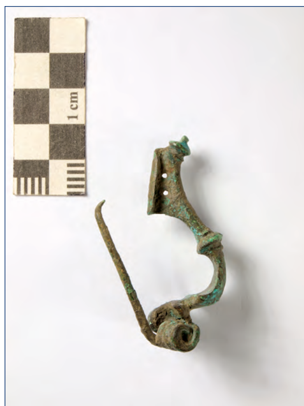
Slika 3, 4. Snažno profilirana fibula, kat. br. 2