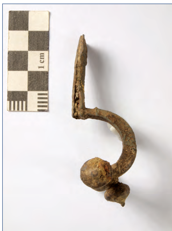
Slika 29, 30. Lukovičasta fibula, kat. br. 15 (snimio: D. Fajdetić, 2012.)