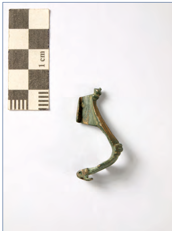
Slika 11, 12. Snažno profilirana fibula, kat. br. 6 Figure 11, 12. Kraftig profilierte fibula, cat. no. 6