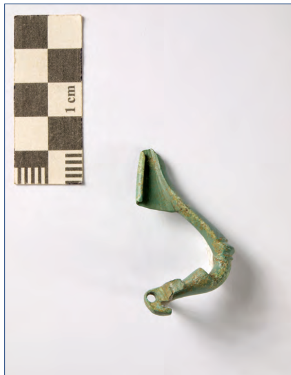
Slika 7, 8. Snažno profilirana fibula, kat. br. 4