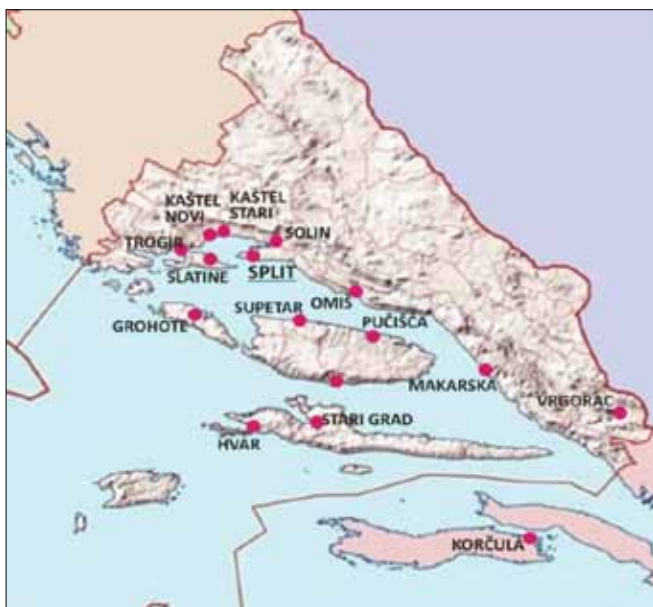
Slika 1. Zastupljenost članova DKST-a po mjestima Splitsko-dalmatinske županije.

Analizirajući i iskazujući brojkama i postocima zastupljenost članova DKST po mjestima Splitsko-dalmatinske županije 2014. godine, zaključujemo sljedeće. Najbrojnije članstvo DKST ima u knjižnicama svog sjedišta – gradu Splitu – 60 članova (72 posto). Potom slijede knjižnice priobalnog područja – na zapad od Solina, Kaštela do Trogira, a na istok od Omiša do Makarske – 13 (16 posto). Unutrašnjost županije ograničena je na samo jednog člana u Vrgorcu (1 posto). Zastupljenost članova na srednjodalmatinskim otocima prisutna je u knjižnicama Šolte, Brača, Hvara i Čiova – ukupno 11 članova (9 posto).