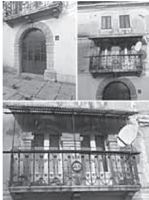
Hrvatski trg, detalji zgrade – portal i balkon

Danas je, nažalost, od cijelog naselja izgrađenog tijekom tih dvaju stoljeća, moguće vidjeti samo ostatke, dijelove izgradnje u obliku dijelova krovništa, prozorskih otvora, ili očuvanih dijelova fasade. Većina je zgrada stradala u bombardiranjima tijekom Drugoga svjetskog rata ili su gradnje sakrivene kasnijim obnovama. Uzimanjem u obzir obiju grafika, konzervatorske podloge te vidljivih i preostalih dijelova izgradnje 17. i 18. st., moguće je stvoriti sliku o razvoju Buraja tijekom tih dvaju stoljeća. Na temelju Petronijeve grafike i konzervatorske podloge, vidljivo je da su izgradnju središnjeg trga i naselja Buraj činile jednostavne prizemnice ili jednokatnice siromašnijih vlasnika, ali i veći stambeni blokovi, višekatnice s unutrašnjim dvorištem, u vlasništvu bogatijih stanovnika. 201 Radmila Matejčić pretpostavlja kako je u tom dijelu grada bilo sagrađeno tek nekoliko većih zgrada, čiji su vlasnici bili doseljeni furlanski i slovenski obrtnici, ali ističe kako je »na toj arhitekturi bio vidljiv jedva pokoji znak stila«. 202 Izrazitih baroknih stilskih značajki u arhitekturi Pazina nema, već se ona, kako