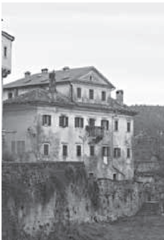
Kuća na ulazu u ulicu Bune kmetova, pročelje

ca jednostavno oblikovanog pročelja. 196 Na pročelju kuće moguće je iščitati unutrašnjost građevine: osim prizemnih ulaznih prostora, zgradu čine dva kata te istaknuti tavanski dio. Prizemni dio čini više ulaza u kuću, a gornji su katovi raščlanjeni s po sedam prozorskih otvora. U središnjim se dijelima drugog kata, umjesto prozorskih otvora, nalazi balkon poduprt jednostavnim kamenim konzolama. Rizaliti je dio jednostavan dekorativni dodatak građevini: čine ga tri prozorska otvora te lagano uzdignut razlomljen krovni iznad.