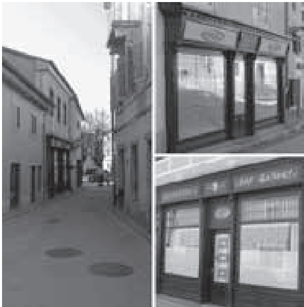
Korzo, drveni izlozi

kciju sajmišta podupirali su izlozi brojnih trgovina čiji su prizemni dijelovi bili ukrašeni drvenim izložbenim pročeljima, od kojih je još nekoliko i danas vidljivo. Zbog nivelacije terena i uspona ulice od Starog trga prema istoku, etažnost građevina varira. U okrugu Starog trga to su većinom monumentalnije dvokatnice, veće građevine u vlasništvu bogataša, dok se na kraju ulice izgrađuju većinom jednoetažne građevine, tlocrtno jednostavnije i manje, a većinom su služile kao trgovine. Pročelja su građevina jednostavna, s naglašenim doprozornicima i natprozornikom, bez dekorativnih elemenata, osim poneke vegetabilne reljefne dekoracije.