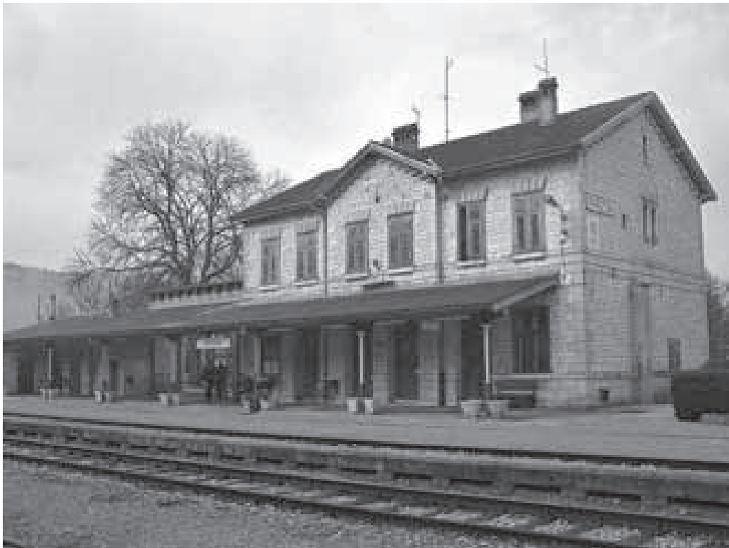
Željeznička postaja Pazin

promatran od istoka prema gradu. S desne se strane tako vidi napola prazan prostor koji se u drugoj polovici 19. i tijekom cijelog 20. st. ispunjava izgradnjom stambenih vila bogatih pazinskih trgovaca, dok je na lijevoj strani još uvijek vidljiv vrt sv. Petronile. 376