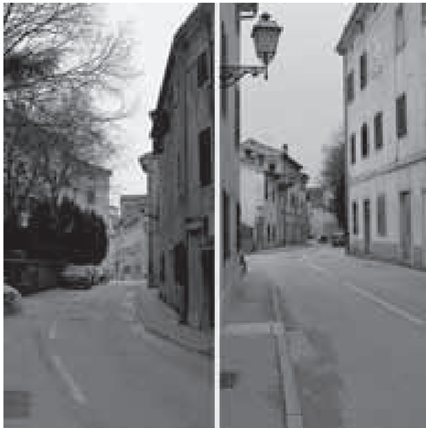
Ulica Prilaz Kaštelu

Na početku su te ulice smještene dva ovelika stambena objekta, vezana jedan uz drugi. Građevine su tlocrtno jednake, obje su dvokatnice i jednostavne u oblikovanju pročelja koja ocrtavaju unutrašnju podjelu prostorija. Kako su obje građevine nastale u drugoj polovici 17., pregradnje kasnijih stoljeća (naročito tijekom 19. st.) utjecale su na izgled i djelomice sakrile izvorne konstrukcije. Pročelje zapadnije od dviju zgrada u potpunosti je prekriveno intervencijama izgradnje 19. stoljeća. 227 Istočnija je građevina danas stambeno-poslovna građevina, također pročelnih karakteristika 19., a elementi su ranije izgradnje vidljivi u podrumu gdje se u temeljima građevine nalaze četiri luka, izvorno iz 17. stoljeća. 228