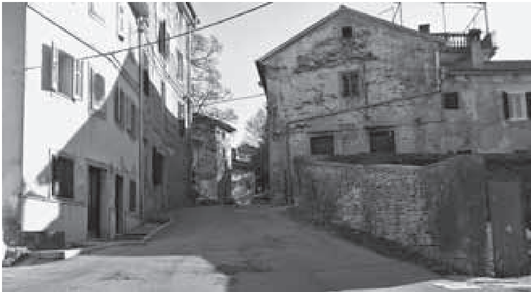
Uspon prema Buraju, pogled od Kaštela

Glavni je trg naselja (danas Hrvatski trg ) većinom oblikovan tijekom izgradnji 17. i 18. st. pročeljima koja i danas svjedoče o širenju i rastu tog naselja istočno od zidina. Nekad kvart siromašnih trgovaca i obrtnika, usprkos stalnoj naseljenosti i izgradnji od najranijih razdoblja razvoja Pazina, svoje lice također duguje izgradnji, nadogradnjama i preinakama 19. stoljeća. Rastom naselja, ali i cijelog grada, rasla je i potreba za probijanjem i izgradnjom novih ulica koje bi povezale sve dijelove grada. 286 Prije 19. st. glavni je burajski trg jednom ulicom bio spojen s kaštelom (danas Ulica Julesa Vernea ), a velik je broj prečaca spajao trg s novom glavnom gradskom ulicom izgrađenom tijekom 18. st. (danas ulicom Prilaz Kaštelu ). Nove se ulice probijaju i granaju u svim smjerovima u 19. stoljeću; u potpunosti se izgrađuje i urbanizira ulica u smjeru franjevačkog samostana (danas Ulica Vladimira Nazora ), kao i jedna usmjerena prema jugu, kao svojevrstan izlaz iz grada (danas Ulica Buraj ). Osim izgradnje i urbanizacije velikog broja ulica, razni se prečaci probijaju u svim smjerovima grada pa je tako središnji burajski trg postao povezan s ostalim važnim ulicama i prometnicama razgranatom mrežom ulica, uličica i prolaza. Trg je, dakle, tijekom 19. st.