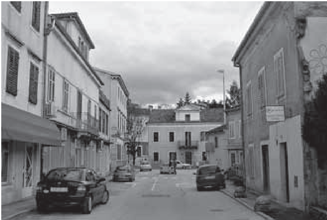
Nova ulica, pogled prema istoku

plašt odaje da je vlasnik ove kuće vjerojatno bio neki bogati Pazinjan, a i njen smještaj nagoviješta razvoj i izgradnju ondašnje (i današnje) glavne ulice na kojoj su bile smještene administrativno važne građevine, kao i vile imućnih stanovnika grada – Poštanske ulice .