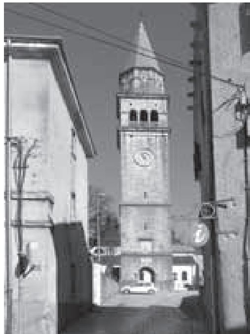
Pogled prema župnoj crkvi (lijevo, zgrada prezbitera)

O izgledu i veličini naselja oko župne crkve danas ne znamo ništa, a niti jedan objekt originalne izgradnje, nažalost, nije očuvan. Osim pretpostavke o izgradnji stambenih objekata oko crkve, sa sigurnošću možemo utvrditi kako je nedaleko crkve bio sagrađen župni dvor, dok je s njene sjeveroistočne strane sredinom stoljeća sagrađeno svratište za siromašne građane Knežije. Ulicom koja vodi prema crkvi (danas Prolaz Vincenta od Kastva ), dominirala je kuća prezbitera sagrađena krajem 15. st., 146 pa pretpostavka o postojanju naselja oko crkve u 16. stoljeću ne bi bila pogrešna. O izgledu kuće danas nemamo podataka, s obzirom na to da je prekrivena slojem izgradnje iz 17. i 18. stoljeća.