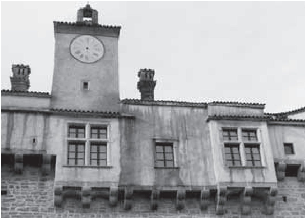
Kaštel, toranj s preslicom

istoku, koja je bila najstariji dio utvrde te simbol grada, srušen do razine krova. 273 Kamenim kvadrima kule popločene su neke pazinske ulice te poravnat teren ispred kaštela stvarajući na taj način trg. 274 Osim toga, na kaštelu su probijeni još neki prozorski otvori na gornjim etažama, u potpunosti se prilagođavajući stambenoj funkciji koju je kaštel od tada imao. U to je vrijeme utvrdu dozidan i toranj s urom i preslicom, čime se mijenja izgled istočnog pročelja, 275 a što je zabilježeno na velikom broju razglednica s kraja 19. stoljeća.