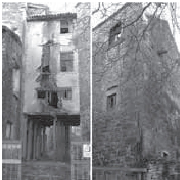
Ulica Bune kmetova, ruševine kuća povezanih mostom