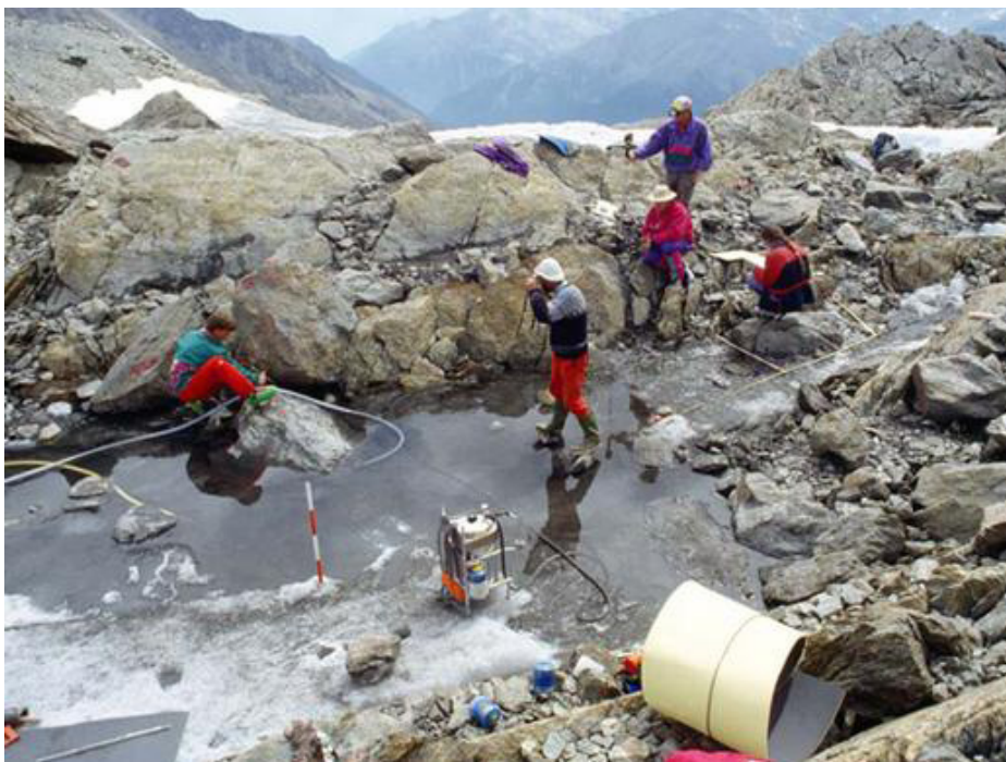
Proces izvlačenja tijela

Zovu ga i " Homo tyrolensis ", a s datacijom od otprilike 5300 godina prije sadašnjosti predstavlja najstarije potpuno očuvano tijelo čovjeka na europskome tlu. Bio je visine 165 cm, težio 50-ak kilograma, u 45. godini života (što je u to doba bila prilično stara dob) i imao smeđe oči. U trenutku pronalaska težio je samo 13,75 kg, čemu su pogodovali klima, temperatura i utjecaj ostalih prirodnih sila, a isti utjecaji vanjskih okolnosti na tijelo uzrokovali su prijelome 3-4 rebara (napuknutih pod težinom leda) kao i potpuno uništenje vanjskoga sloja kože, epidermisa.