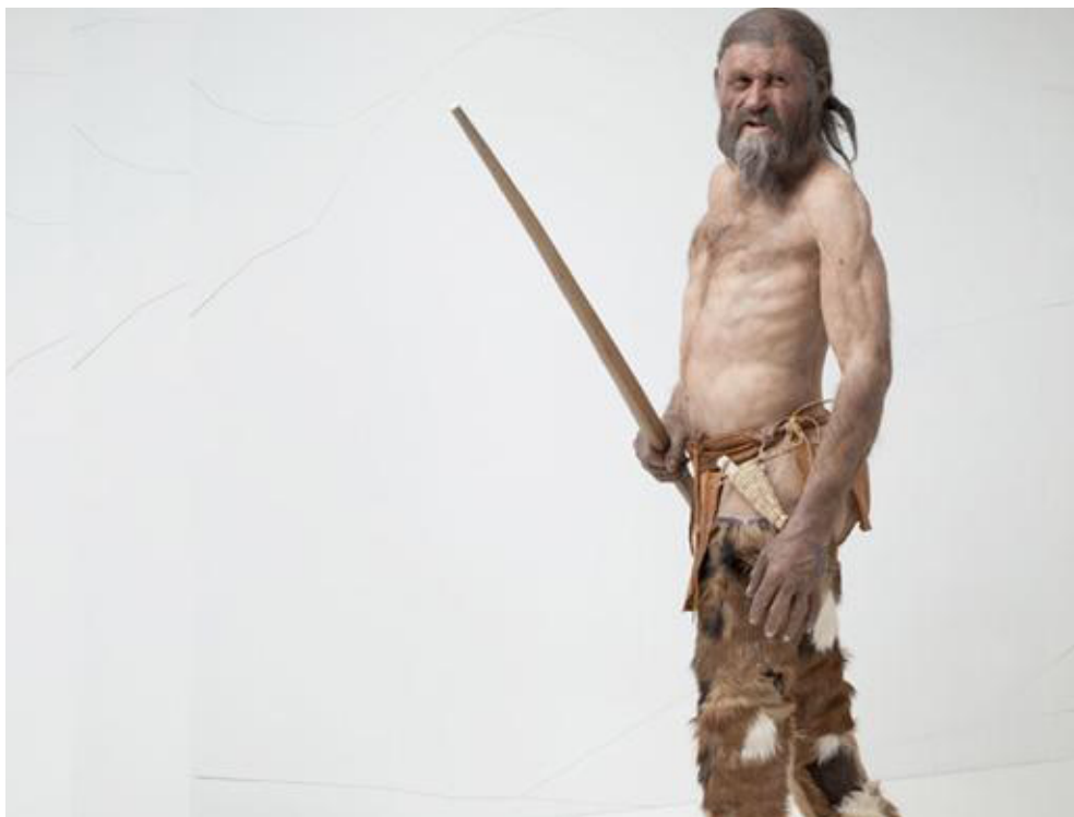
Ötzi The Iceman, rekonstrukcija