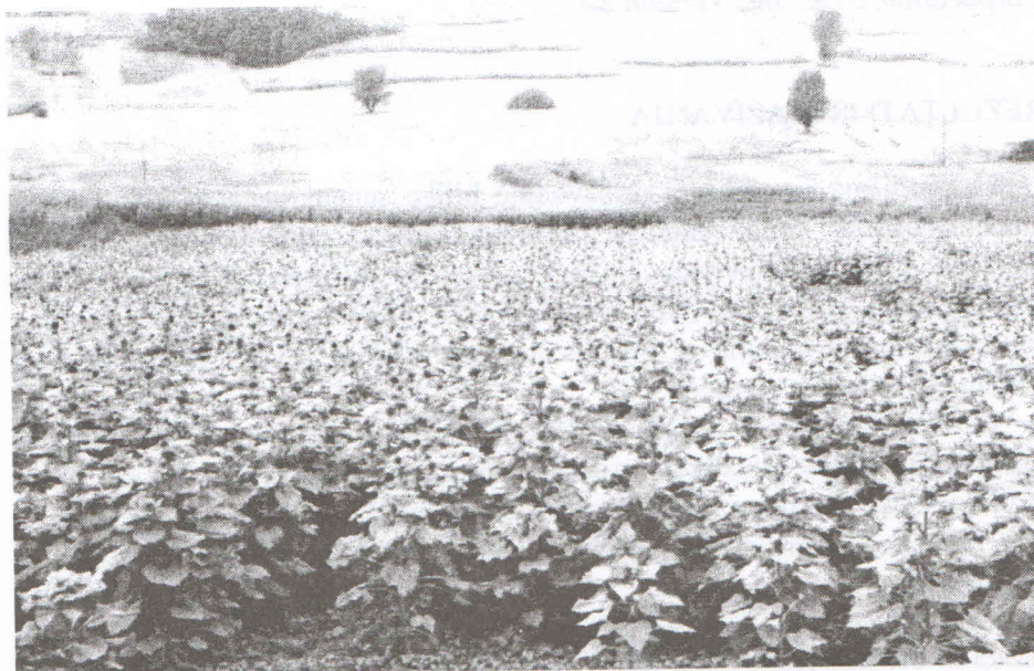
Slika 1. Suncokret u punoj vegetaciji, 2000. godina Figure 1. Sunflower in full flowering, year 2000

Na osnovi kemijskoga sastava izračunat je sadržaj neto energije za laktaciju (NEL), neto energije za meso (NEM), te metaboličke energije (ME) u 1 kilogramu biljke suncokreta. Na temelju izračunatoga sadržaja NEM-a i NEL-a izvršena je procjena realno možebitne proizvodnje mlijeka (3,5 NEL/1 kg mlijeka) i goveđeg mesa (50,0 NEM/1 kg prirasta) po 1 ha, suncokreta kao međusjeka za stočnu krmu.