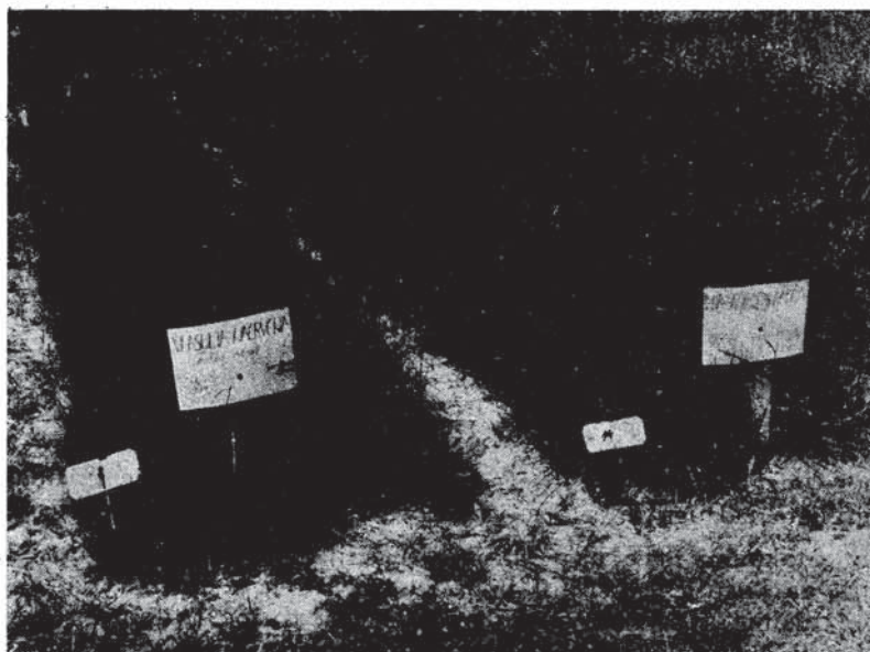
Sl. 1. Sortni pokus vlasulje nacrvene ( Festuca rubra ) i vlasulje livadne ( Poa pratensis ) Varietal test with Cherwing fescue (Festuca rubra) and Kentucky bluegrass (Poa pratensis)

sa 50 kg/ha N. Ukupna količina fosfora ( P_2O_5 ) iznosila je 170 kg/ha, a kalija ( K_2O ) 200 kg/ha. Dušična gnojiva davana su iza svakog otkosa u količini od 50 kg/ha, uključujući i zadnji otkos. Osnovna parcelica pokusa bila je veličine 6 \times 1 = 6 \text{ m}^2 . (Sl. 1).