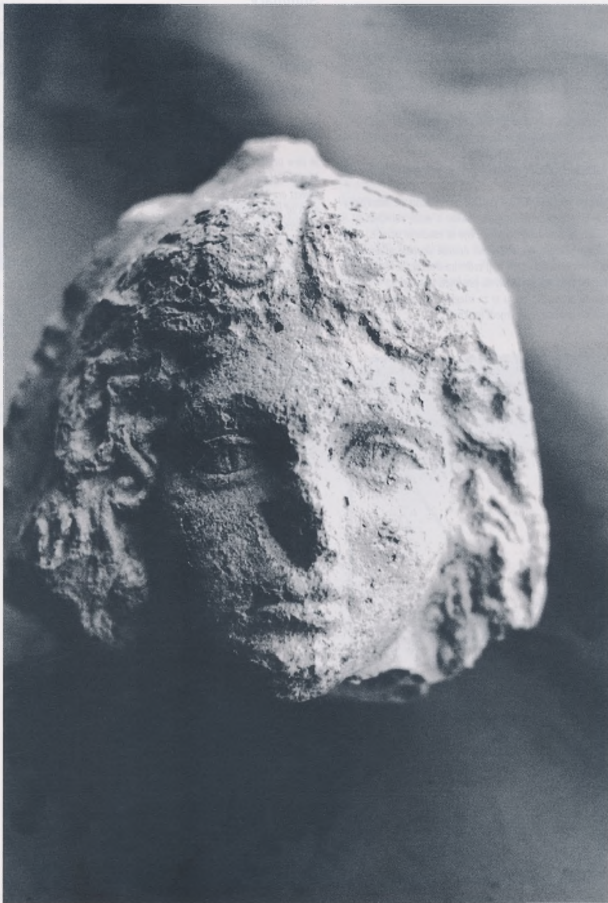
Keramički antefiks s likom Meduze