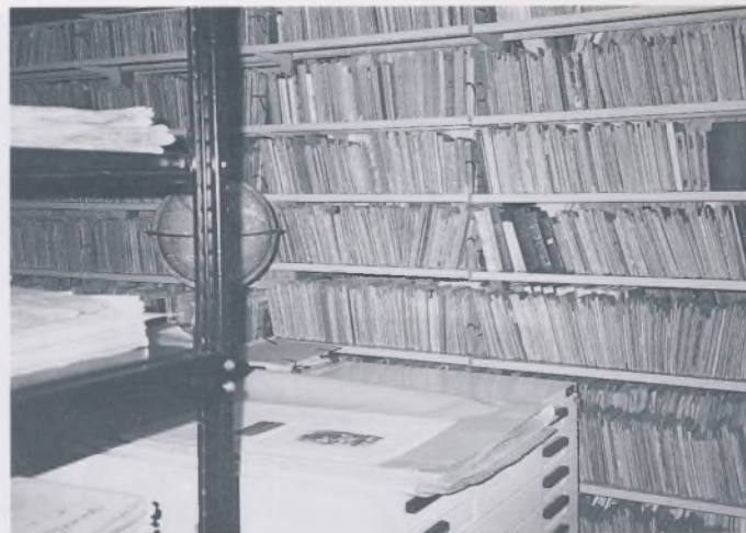
Pogled na Bogišićevu knjižnicu i depo grafičke zbirke, I. kat, soba VII snimio: Mateo Rilović, svibanj 1997.

Kulišić, Frano. 1909-1911. Bogišićeva biblioteka . 1. knjiga A-L, br. 1-2.608. 2. knjiga M-Z, br. 2.609-5.141. Nepaginirano. Autorski katalog knjižnice.Uz