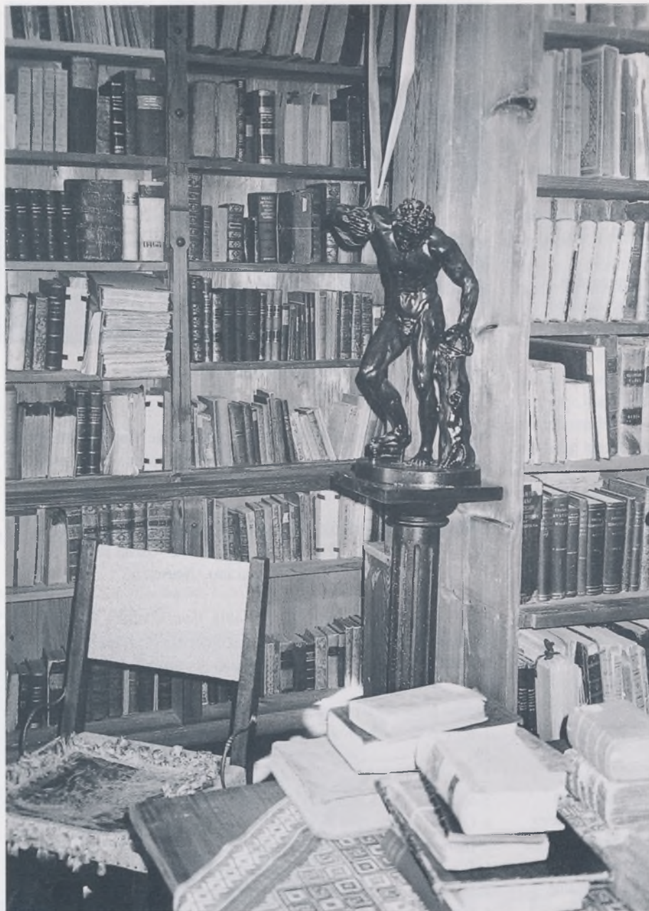
Dio Bogišićeve knjižnice I. kat, soba IV snimio: Mateo Rilović, svibanj 1997.