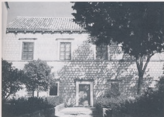
Pročelje kneževa dvora, pogled sa zapada snimio: Mateo Rilović, svibanj 1997