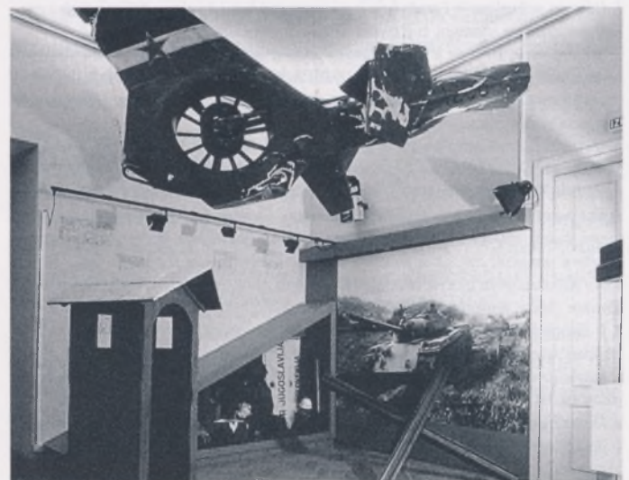
Detalji iz novog postava Muzeja noveše zgodovine u Ljubljani: Samostalna Slovenija, dvorana I

Tenkovski rat simbolizira velika fotografija kolone tenkova u pokretu (ispred koje je postavljen protutenkovski jež), a nesigurnost iz zraka ostaci uništenoga vojničkoga helikoptera (obješeni o strop izložbene dvorane). Na površini koso postavljene vitrine u lijevom dijelu sobe dana je kronologija događaja (i vojnih i civilnih), iz kojih je kao sveukupni rezultat izrasla samostalna Republika Slovenija. U vitrini, odbačena oprema vojnika Jugoslavenske narodne armije i granična ploča: SFR Jugoslavija/Slovenija. U desnom dijelu sobe prikazani su civilni događaji i njihovi glavni protagonisti: pojava stranaka i njihovi programi, prvi stranački izbori, plebiscit i proglašenje samostalnosti. Na zidu (nasuprot fotografiji tenkovske kolone) velika fotografija u boji mnoštva ljudi ispred slovenskog palamenta na dan proglašenja samostalnosti. U prostoriji u kojoj dominira sivomaslinasta boja (boja JNA), izložbenog namještaja i većine izloženih predmeta, ova fotografija simbolizira radost i veselje. Smještena nasuprot tenkova JNA (hladne i uništavajuće tehnike) ona još snažnije naglašava pobjedu ujedinjenog naroda nad silom.