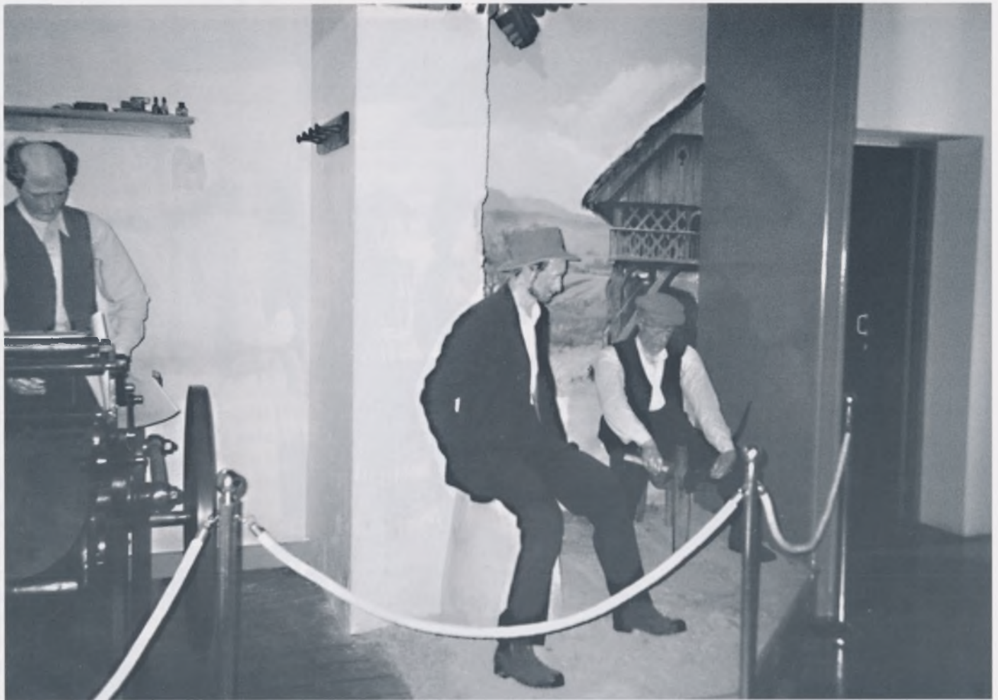
Detalj iz novog postava Muzeja novejšeg zgodovine u Ljubljani: Slovinci između dva svjetska rata, dvorana C i D

Nova stalna izložba temelji se na fondusu mnogobrojne muzejske građe. Muzejske zbirke počele su nastajati još u Drugom svjetskom ratu. 4 U prvim