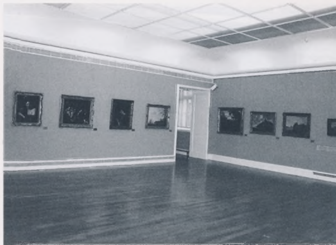
Holandski barok

ne prepoznaje veliki holandski slikar Jan Steen u Muzeju Mimara iz prosta razloga što većina nije nikad čula njegovo ime. Nameće nam se pedagoški rad s posjetiteljima kao značajan element u osvješćivanju likovne kulture i u uspostavljanju trajna dijaloga muzeja i njegove publike. S obnovljenim stalnim postavom i prestankom rata u muzeju se obnavlja i rad "Kluba Mimara", "Male likovne radionice" kao i vodstva po stalnom postavu.