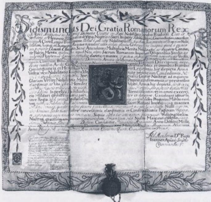
Grbovnica Rudolfa, Hrvatski povijesni muzej

Z birka heraldike, osnovana tijekom 1970. godina, ubraja se među najmlađe zbirke Hrvatskog povijesnog muzeja, iako su pojedini njezini predmeti među prvima dospjeli u muzejski fondus još polovicom 19. stoljeća. Kao jedna od najmanjih zbirki po broju primjeraka koje čuva, ona ujedno spada među najbolje obrađene i najviše publicirane od svih kolekcija ovoga muzeja, budući da su dosad objavljena čak dva izdanja njezina kataloga 1 . Zanimljiva je, također, činjenica da je Zbirka primjer vrlo rijetke prakse organiziranja heraldičkih predmeta u zasebnu cjelinu te da je jedna od najvećih te vrste u nas, uzmemo li u obzir i arhivske kolekcije heraldike 2 . Zbog toga, kao i zbog slabijeg interesa za ovu vrstu izvorne građe u stručnim krugovima historičara i muzealaca različitih specijalizacija (unatoč njezinoj trenutnoj popularnosti), ovom bismo joj prilikom željeli posvetiti naročitu pozornost. Na sljedećim ćemo stranicama, stoga, naznačiti osnovne momente povijesnog nastanka, kreiranja sadržaja i eventualnog daljnjeg razvoja heraldičke zbirke Hrvatskog povijesnog muzeja. Međutim, prije svega smatramo potrebnim objasniti koje su to specifične osobine "heraldičke muzealije" po kojima se ona razlikuje od ostalih muzejskih predmeta, a koje joj danas, kao i tijekom prošlosti, velikim dijelom određuju mjesto i značaj unutar cjelokupnog muzejskog fundusa.