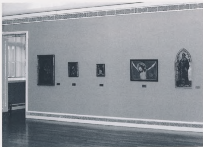
Talijansko slikarstvo: tonda u osi kretanja

ispitivanja pigmenta boje i podloga (nužna za konačni sud o atribuciji slike) nema sredstava, a nismo uspjeli nabaviti kartone koji bi zaštitili platna slika sa stražnje strane.