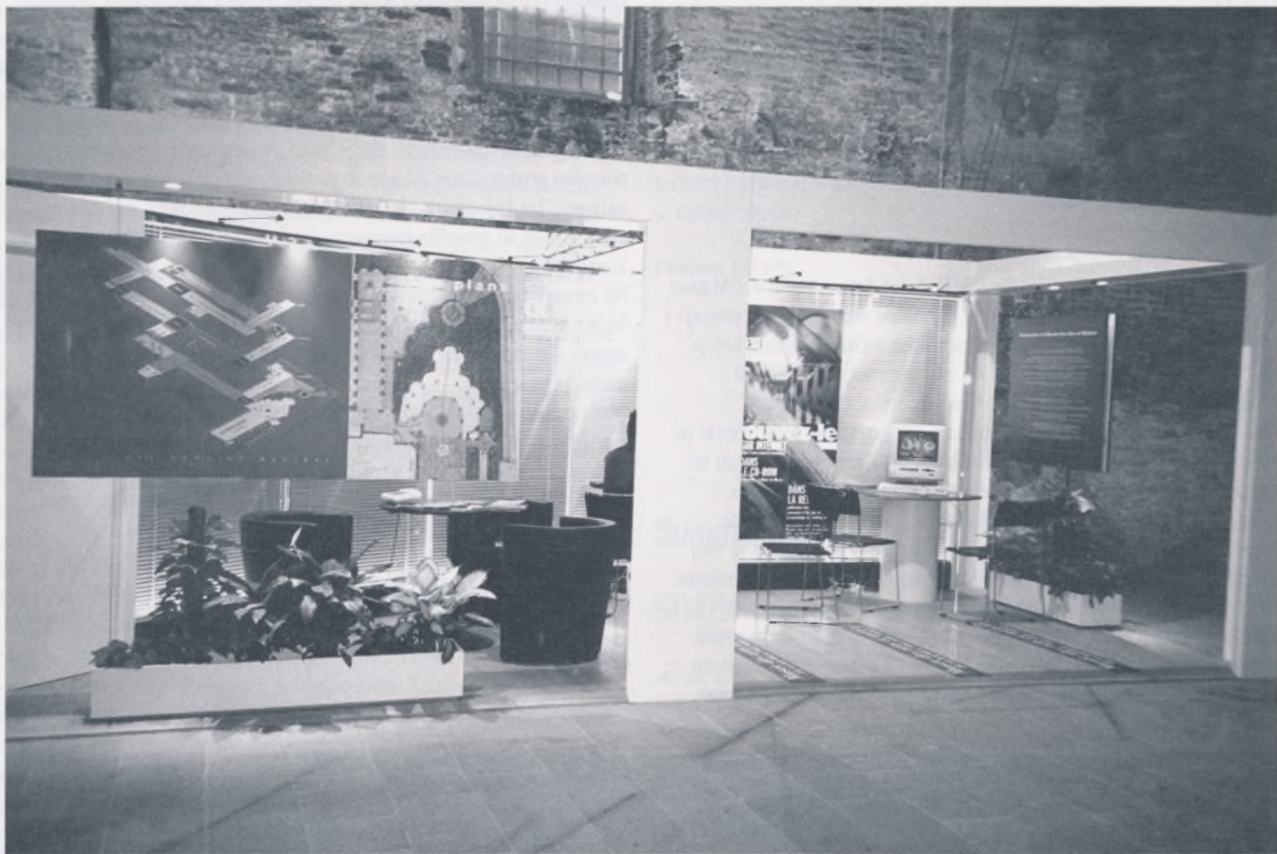
Musée des Arts et Metiers (Muzej za umjetnost i obrt) iz Pariza u svom izložbenom prostoru je predstavio i CD-rom o kolekcijama muzeja