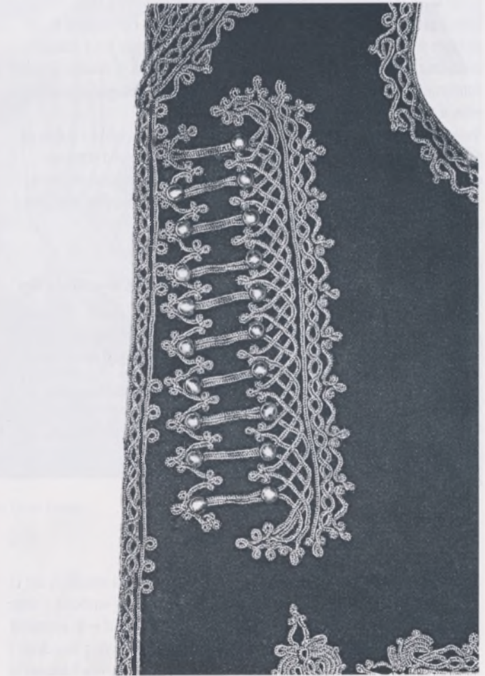
Dio prsluka poslije konzervatorsko-restauratorskih radova