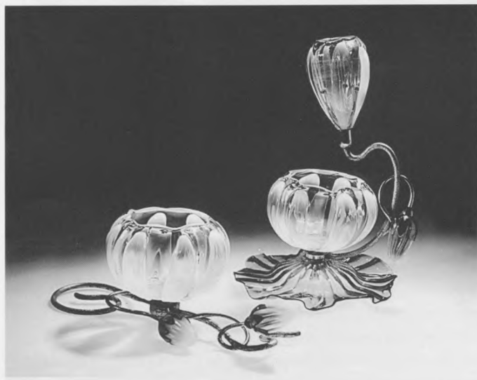
Predmet izložen u sklopu novog stalnog postava Zbirke stakla

Za muzej koji je osnovan 1852. godine i neprekidno radi do danas, svaka promjena i odklon od tradicije predstavlja gotovo revolucionarni čin. No, čini se da je politika muzeja u odnosu na nužnu modernizaciju stalnog postava zauzela dosta pragmatičan stav: obnavljaju se samo određene izložbene cjeline, tako da se ne prekidaju ustaljene aktivnosti i djelatnosti muzeja. Otprilike jednom godišnje otvara se jedan obnovljeni segment, tematski postav. Prošle je godine Victoria & Albert Museum realizirao dva takva postava, izložbe željeza i stakla.