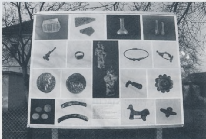
Informativna ploča s fotografijama u boji arheoloških nalaza (staklo, metal, kost)

Na ovoj arheološkoj lokaciji nije prezentirana samo atraktivna rimska arhitektura nego se posjetiteljima prikazuje i način rimske gradnje, oprema zgrada, preslojavanje arhitekture, konstrukcija rimske ceste, predmeti za