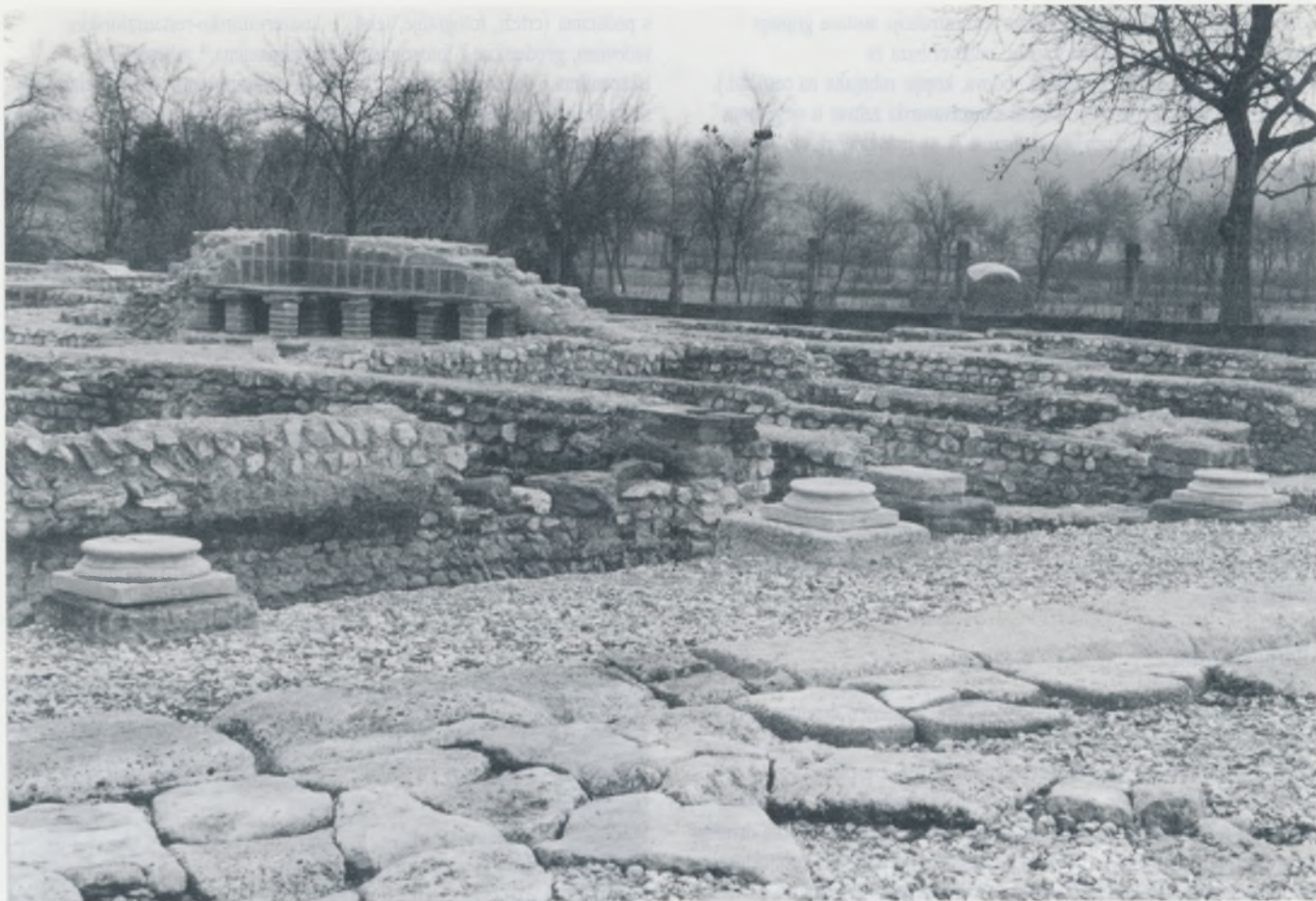
Dio ulice s rekonstrukcijom rubnjaka i trijem s odljevima baza za stupove te zgrada kupališta s djelomičnom rekonstrukcijom hipokausta.